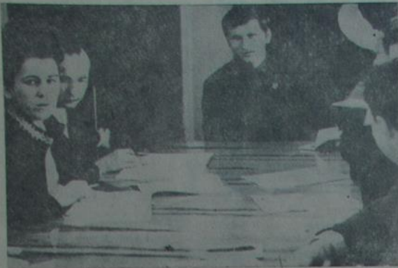
Раішэнні XXIV з'езда партыі—у жыццё!