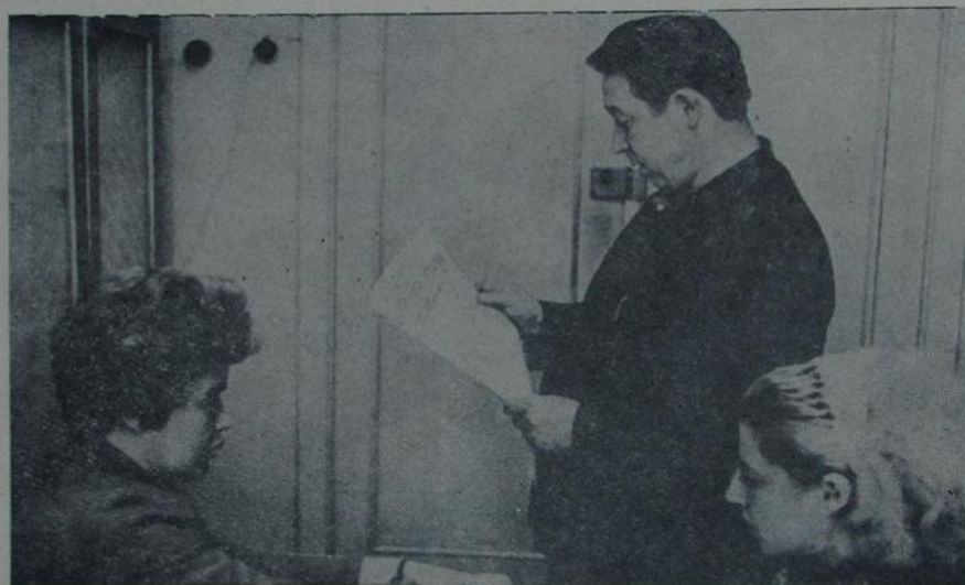
Заканчваецца прыём дакументаў на адзіленне залочнага навуачнага 425 першакурнікаў. На здымку: работнік прыёмнай афармляе дакументы абітурыентаў.

В. ГРОМОВА, выкладчыца кафедры рускай літаратуры.