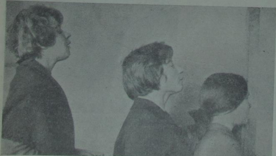
— Цікава, як там нашы трымаюцца? Мо' і «ахвяры» ўжо ёсць?