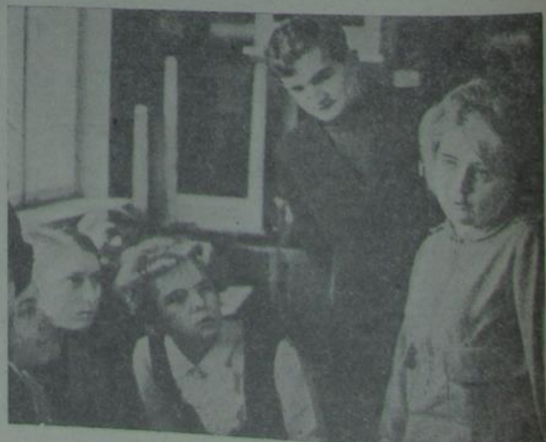
Маса пытанняў. Адказу пакуль няма...

выдатна. Акрамя тэорыі, у нас было многа практыкі. Можна смела сказаць, што кожнае тэарэтычнае палажэнне праходзіла праверку шляхам напісання лабараторных работ. У. Ф. Філішоў тут жа, як кажуць, па ходу дзеяння, даваў вычарнальныя кансультацыі па таму ці іншаму пытанню. Тое, што мы здалі гэты прадмет без дрэнных