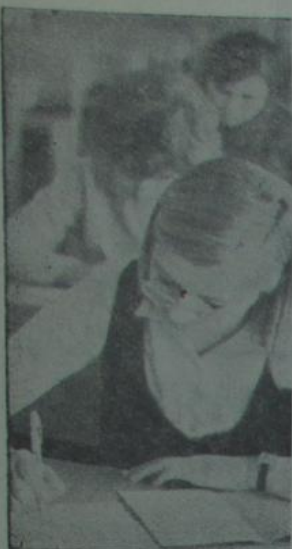
На здымку: здымачы — сама ўвага.

Р. НЯМЦОУ, студэнт 4 курса гісторыка-філалагічнага факультэта.