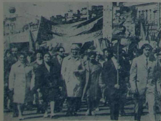
На здымках: у калоне біёлага-глебавага факультэта (злева). Будучыя спецыялісты фізічнага выхавання.

Ідзе савецкае юнацтва — шчаслівае, маладое пакаленне сацыялістычнай Айчыны, тэя, каму ў бліжэйшыя гады прадстаць за-