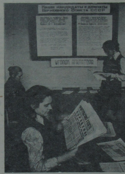
У першым вучэбным корпусе нашага ўніверсітэта размясціўся агітпункт выбарчага ўчастка № 23/141. Кожны дзень тут бываюць наведвальнікі. Людзі прыходзяць, каб знаёміцца з літаратурай аб савецкай выбарчай сістэме, атрымаць кансультацыі, вырашыць якое-небудзь іншае пытанне, ці проста папрывітацца на цікавай гурткай. НА ЗДЫМКУ: у пакоі агітпункта.

Ужо ў гэтым годзе, па выніках вясенняй экзаменацыйнай сесіі, новыя стыпендыі атрымаюць студэнты-фізікі, якія сумяшчаюць выдатную вучобу і плённую даследчыцкую дзейнасць у студэнцкім навуковым таварыстве. Пры выборы кандыдатур будзе ўлічана і актыўны ўдзел студэнтаў у грамадскай рабоце і маладзёжным руху.