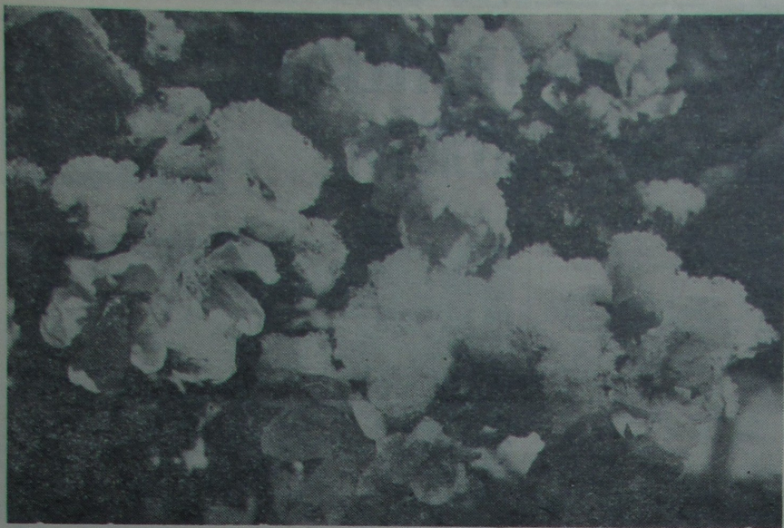
СНЕГ НА МАЙСКОЙ КВЕЦЕНІ.