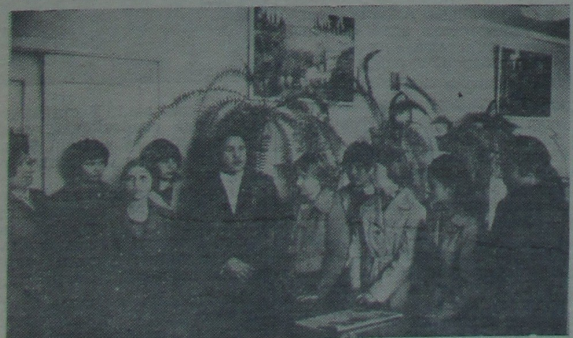
Гэты здымак быў зроблены 19 мая, калі ва ўніверсітэце праводзіўся традыцыйны «Дзень адкрытых дзвярэй». Сярод будучых абітуріянтаў, а цяпер яшчэ школьнікаў, было нямала жахчых вучыцца ў біёлага-глебавага факультэта. Яны сустрэлі даючых наступіць на біёлага-глебавага факультэта. У той час нашай Дружныне быў толькі адзін год.

Ад імя Дружныны па ахове прыроды — М. БЛЯХЕР, студэнт трэцяга курса.