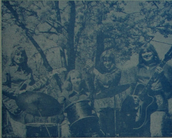
Чудоўны святочны настрой у гэтых дзяўчат з вакальна-інструментальнага ансамбля «Сонейка» біёлага-глебавага факультэта. Іх выступленне адзначана на абласным аглядзе-конкурсе, які прысвячаўся 30-годдзю Вялікай Перамогі, шмат апладысмантаў заслужылі яны на ўніверсітэдзім конкурсным канцэрце, а таксама на канцэрце ў гонар Першамайскага свята.

Беларускі паэт Кастусь Кірэнка закончыў літаратурны факультэт Гомельскага педінстытута ў 1940 годзе. Хаця ён з Магілёўчыны, палюбіў наш горад. Там, у Слаўгарадскім раёне, дзе нарадзіўся Канстанцін Ціханавіч, як і ў Гомелі, ціха нясе свае воды Сож. Вобраз роднай рэчкі паўстае з многіх вершаў паэта. У гады вайны К. Кірэнка быў ваянным карэспандэнтам, удзельнічаў у абароне Масквы, у вызваленні Беларусі і Польшчы. Яго глыбокатэматычныя вершы, датумныя гадамі 1941—45, перадаюць гераізм і мастацкую праўду незабыўных дзён. Смуткам праізаваны радкі паэта, які ён прысвячае свайму таварышу Л. Гаўрылаву, загінуўшаму ў першы год вайны.