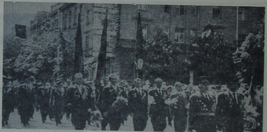
Калоны ветэранаў вайны ў дзень Перамогі.

На сустрэчы выступіў кіраўнік маладзёжнай дэлегацыі з братняй Чэхаславакіі. Ён гаварыў аб тых глыбокіх пацужнях, якія засталіся ў іх ад знаходжання на гомельскай зямлі ў дні святкавання 30-годдзя Вялікай Перамогі, выказаў вялікае задавальненне ад мацнеючай дружбы народаў, якая прайшла сапраўднае выпрабаванне яшчэ ў гады мінулай вайны.