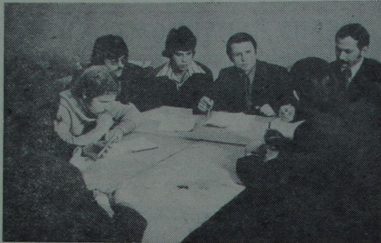
Ідзе пасяджэнне штаба ДНД.

У Цэнтральным раёне Гомеля адной з лепшых лічбыцца добраахвотная народная дружына Гомельскага дзяржаўнага ўні-