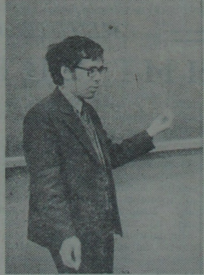
Другі год на кафедры дыферэнцыяльных ураўненняў працуе навукова-метадычны семінар. Яго заняты праводзіцца раз у тыдзень. На адных з іх наш фотакарэспандэнт зафатаграфавалі загалчыка лабараторыі Гомельскага філіяла Інстытута