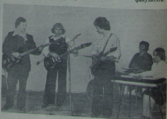
НА ЗДЫМКУ: выступае факультэцкі ВІА «Алгарытм».

баліся песні, танцы, конкурсы, гульні, якія зрабілі мерапрыемства цікавым і захапляльным. У гэтым вялікай заслуга