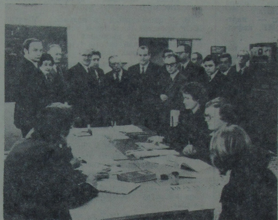
Работа вышэйшай школы нашай краіны на ўсім шляху яе развіцця стаіць у цэнтры ўвагі Камуністычнай партыі і Саветаў урада. Асабліва адказныя задачы, выніваючыя з развіцця XXV з'езда КПСС, належыць вырашыць вучоным і навуковым супрацоўнікам на цяперашнім этапе камуністычнага будаўніцтва. Неабходна пастанова ўдасканаліць вучэбна-выхаваўчы працэс і павысіць якасць падрыхтоўкі маладых спецыялістаў, максімальна набліжыць навуку да практычнага жыцця, сканцэнтраванаць сілы для распрацоўкі важнейшых у народнай гаспадарцы праблем і эфектыўна ўкараніць іх вынікі ў вытворчасць.