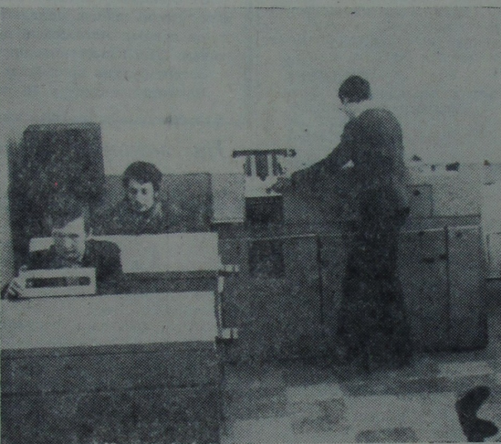
Гэта здымку: у лабараторыі артэхнікі.