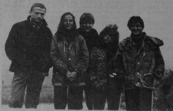
Цікавай была сёлета практыка ў першакурснікаў геалагічнага факультэта. Перад ад'ездам група работ сфатаграфавалася на Лоеўшчыне каля р. Днепр.

Закончылася і другая вытворчая (пераддыпломная) практыка ў студэнтаў 4-га курса, якая праходзіла на тэрыторыі Беларусі і Паловыжы. Выкладчыкі кафедры інжынернай геалогіі і гідрагеалогіі, якія кіравалі ёю, імкнуліся да таго, каб студэнты авалодалі шырокім комплексам даследаванняў і сабрали матэрыял для напісання дыпломнай работы. (Заканчэнне на 4-й стар.)