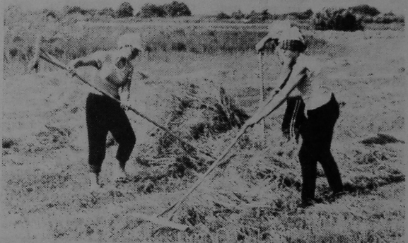
Высушанае сена — ў копы.