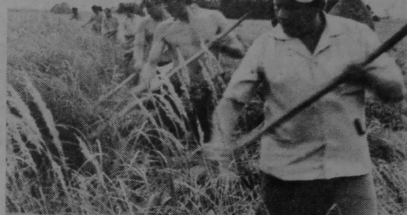
На касьбе траў.