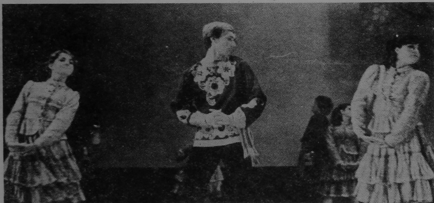
На здымку: выступаюць удзельнікі танца вальнага калектыву ГДУ.