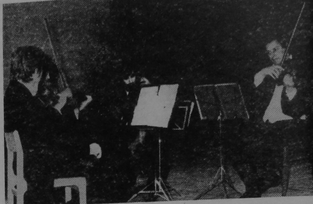
Гасцям нашага ўніверсітэта на гэтым тыдні былі артысты з Вільнюса. У актавай зале выступіў камерны квартэт імя Чурдзіна. Гарачымі апладысмантамі дзякавалі студэнты, выкладчыкі і супрацоўнікі ГДУ ўдзельнікам фестывалю мастацтваў «Гомельская музычная вясна».

А. МАТОРАНКА, студэнт групы 0-43 эканамічнага факультэта.