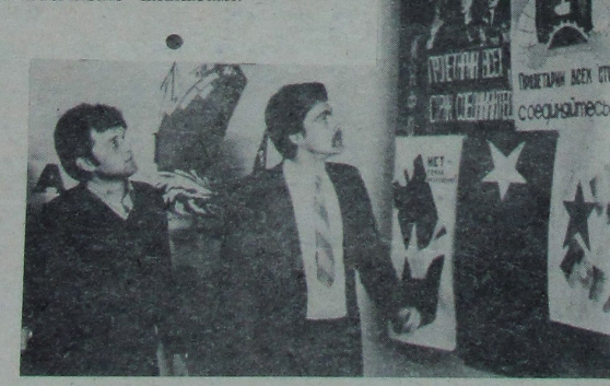
Студэнты ГДУ знаёмяцца з прадстаўленымі на конкурс палітычнымі плакатамі.