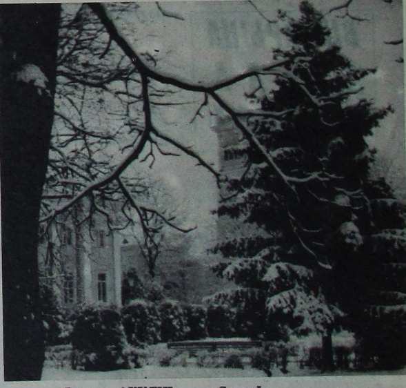
Эдуард АКУЛІН, студэнт 5-га курса гістфіла.

Ледзь да ранку пратрымалася і сышла слягамі талыні, Пачарнелымі прагаламі. Сёння зноў жа з тонкай грацянай Лепіць іней на акацы.