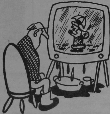
НІЯРОЗНЫЯ СЛЫ. НАДВОР'Е ПАДВЯЛО.