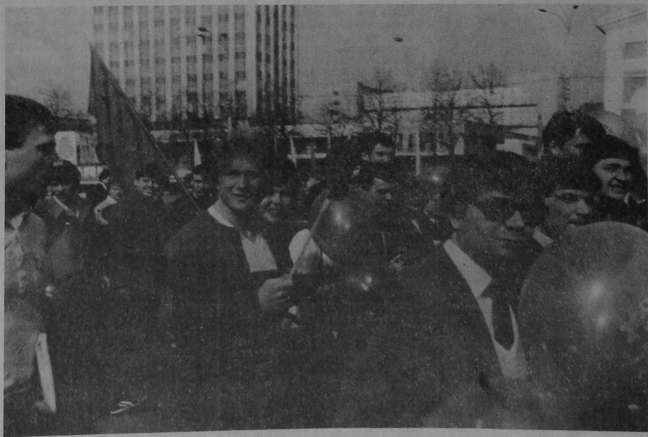
На здымку: у першамайскай калоне ГДУ.

У дзень 1 Мая лепшыя прадстаўнікі ўніверсітэцкага калектыву прынялі ўдзел у святчайнай дэманстрацыі працоўных ардэнаноснага Гомеля.