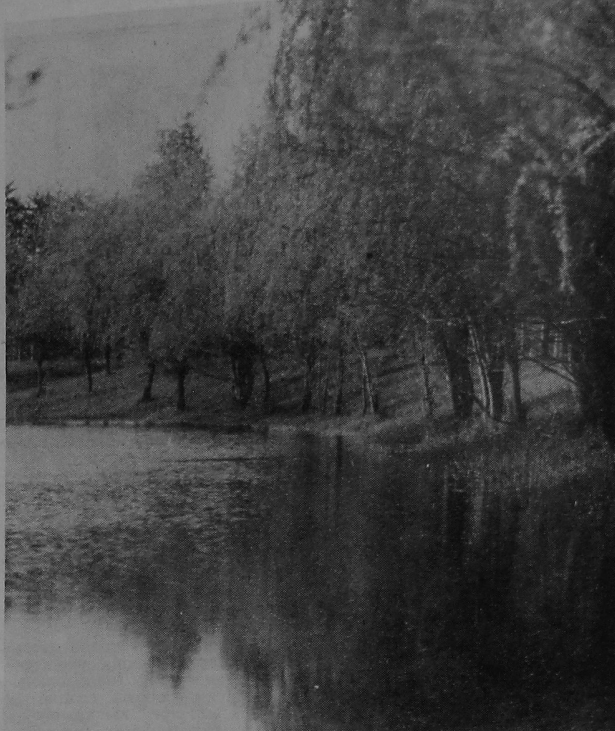
БЛІЗКІЯ СЭРЦУ МЯСЦЫНЫ.

Новыя правілы нацэльваюць прыёмныя камісіі ўлічваць професійную падрыхтоўку моладзі, якая заканчвае спецыяльныя і професійна-тэхнічныя навучальныя ўстановы. Іх выпускнікам, якія атрымалі дыплом з адзнакай або прапрацавалі на спецыяльнасці ўстаноўлены тэрмін, прадстаўлена права пазаконкурснага паступлення ў ВНУ на адпаведны спецыяльнасці.