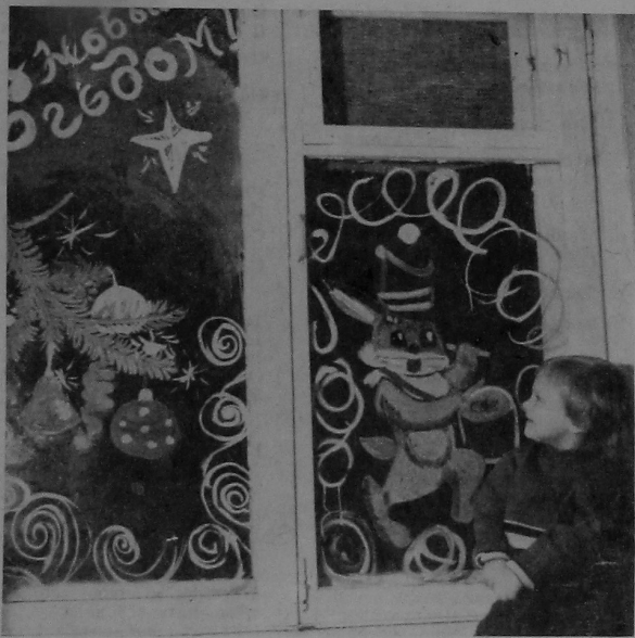
Дзе ж ты, дзядуля Мароз?