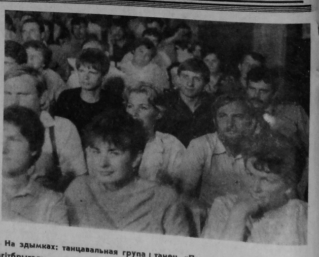
На здымках: танцавальная група агітбрыгады выконвае жартоўны танец «Па дарозе з кірмашу». У гледзельнай зале.

Агітбрыгада універсітэта неадночы выяжджала з канцэртнамі мастацкай самадзейнасці ў падзешнія раёны, у калгасы і саўгасы вобласці. А на гэтым тыдні яе канцэртны маршрут пралёў у г. Хойнікі. Тут яны далі бясплатны канцэрт. У зале Дома культуры «Меліяратар» свабодных месцаў у той вечар не было. Самадзейныя артысты ГДУ спявалі і танцавалі, ставілі жартоўныя сцэнікі са студэнцкага жыцця. Гарачымі і дружнымі апладысмантамі аддзякавалі гледчыя артыстам.