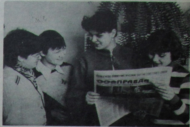
На кожным факультэце, у кожнай студэнцкай групе з цікавасцю знаёмяцца студэнты з матэрыяламі ХХVII з'езда