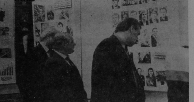
Пасля адкрыцця музея першыя наведвальнікі з вялікай цікавасцю знаёмліліся з яго экспанатамі.