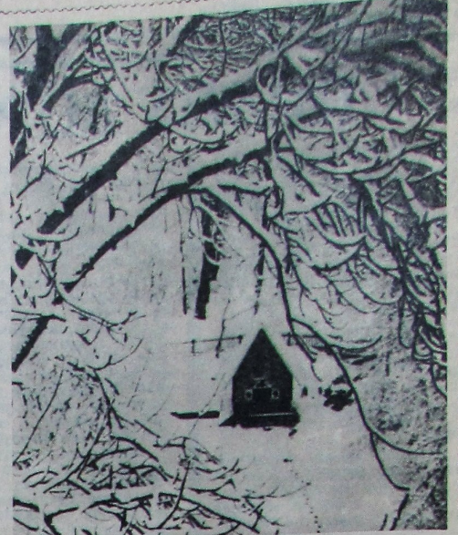
ЯК У КАЗЦЫ.

(Перадновагоднія жарты да- слаў у рэдакцыю Дзед Мароз з розных ВНУ краіны).