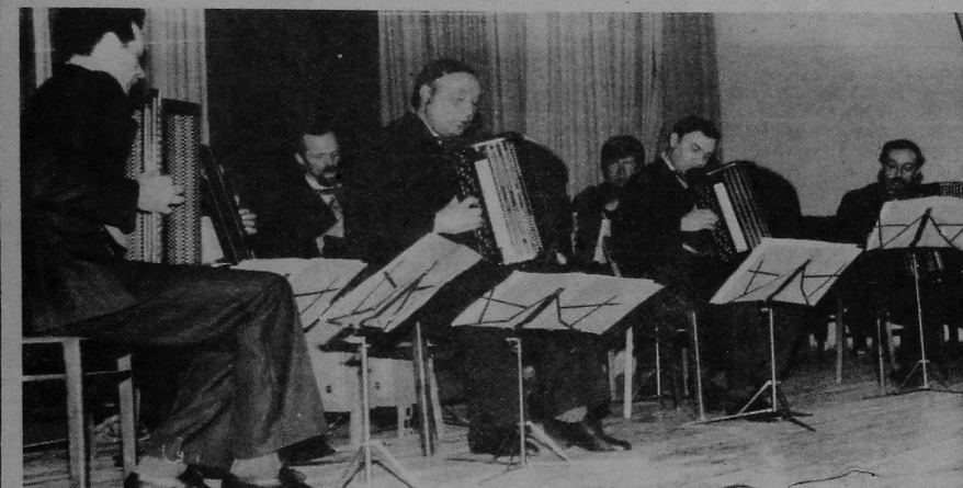
НА ЗДЫМКУ: на сцэне актавай залы ўніверсітэта выступае ансамбль баяністаў педвучылішча.

Дням памяці паэта прысвячалася ў лютаськія дні шмат вечараў, канцэртаў, сустрэч, іншых разнастайных мерапрыемстваў ва ўсёй нашай краіне. У школьных класах і ў студэнцкіх аўдыторыях, у Домах культуры гарадоў і вёсак, каля помнікаў паэту, памятных месц, звязаных з яго імем, пранікнёна гучалі паэтычныя радкі А. С. Пушкіна, а таксама музыка, якая ўзнікла на аснове пушкінскіх сюжэтаў.