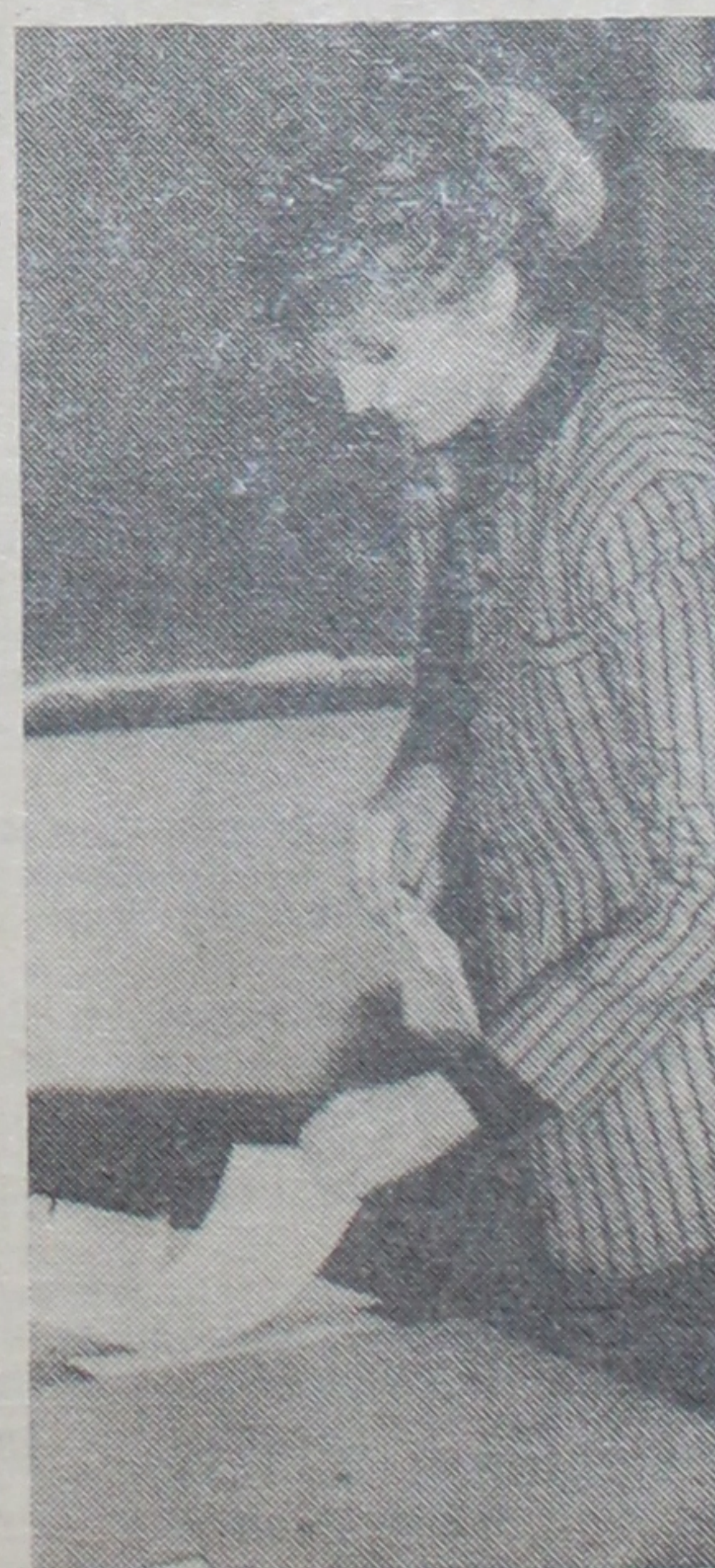
Як жа выцягнуць лёгкі?