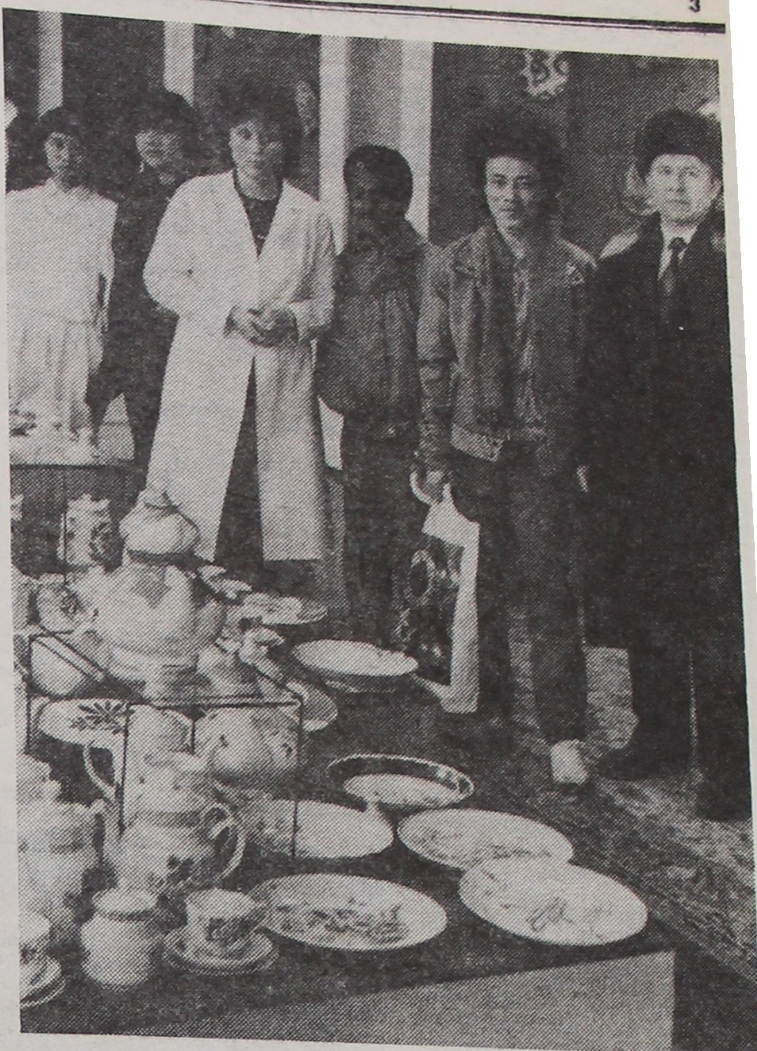
джаюцца гэтыя цуда — вырабы.