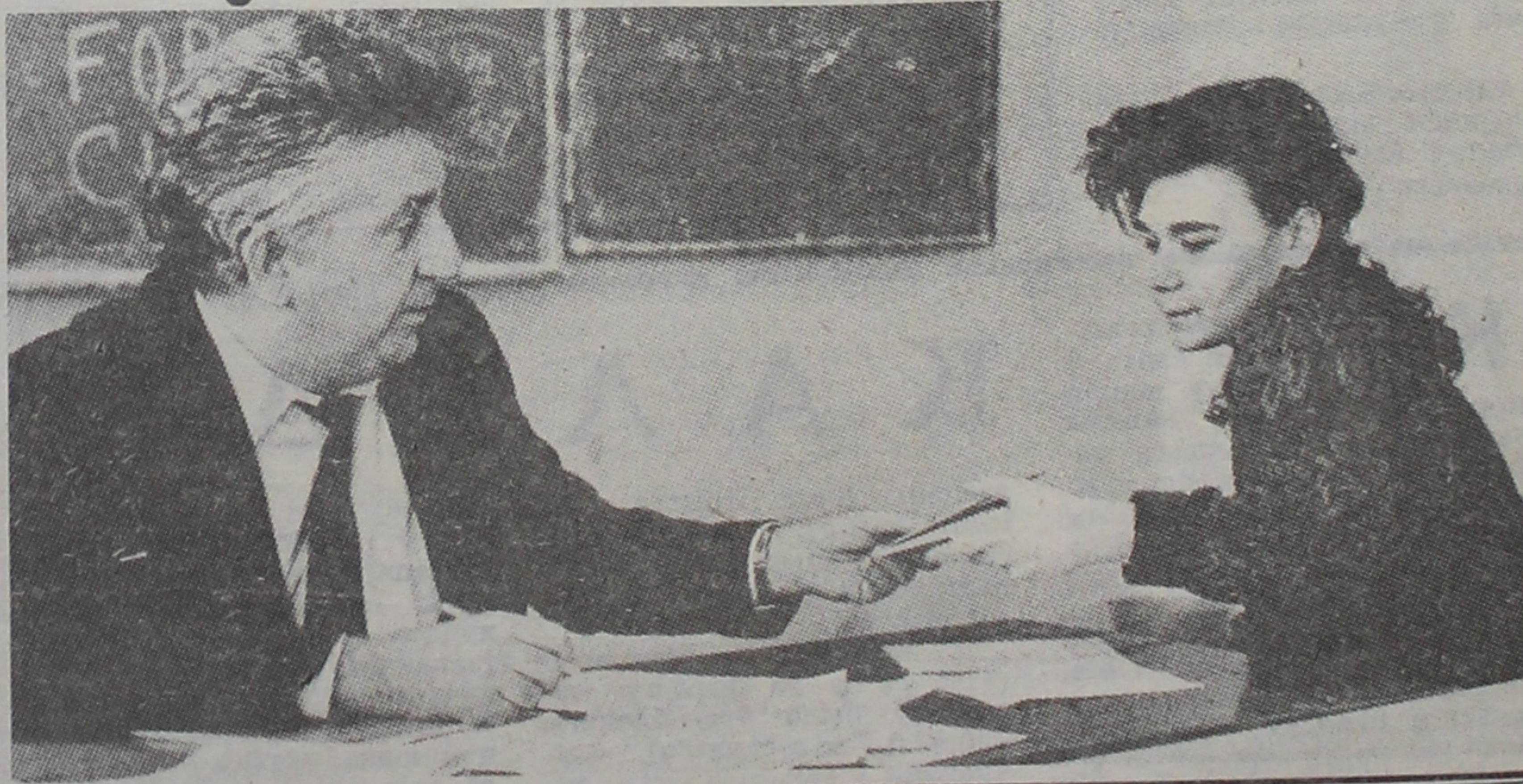
На вучоным савеце