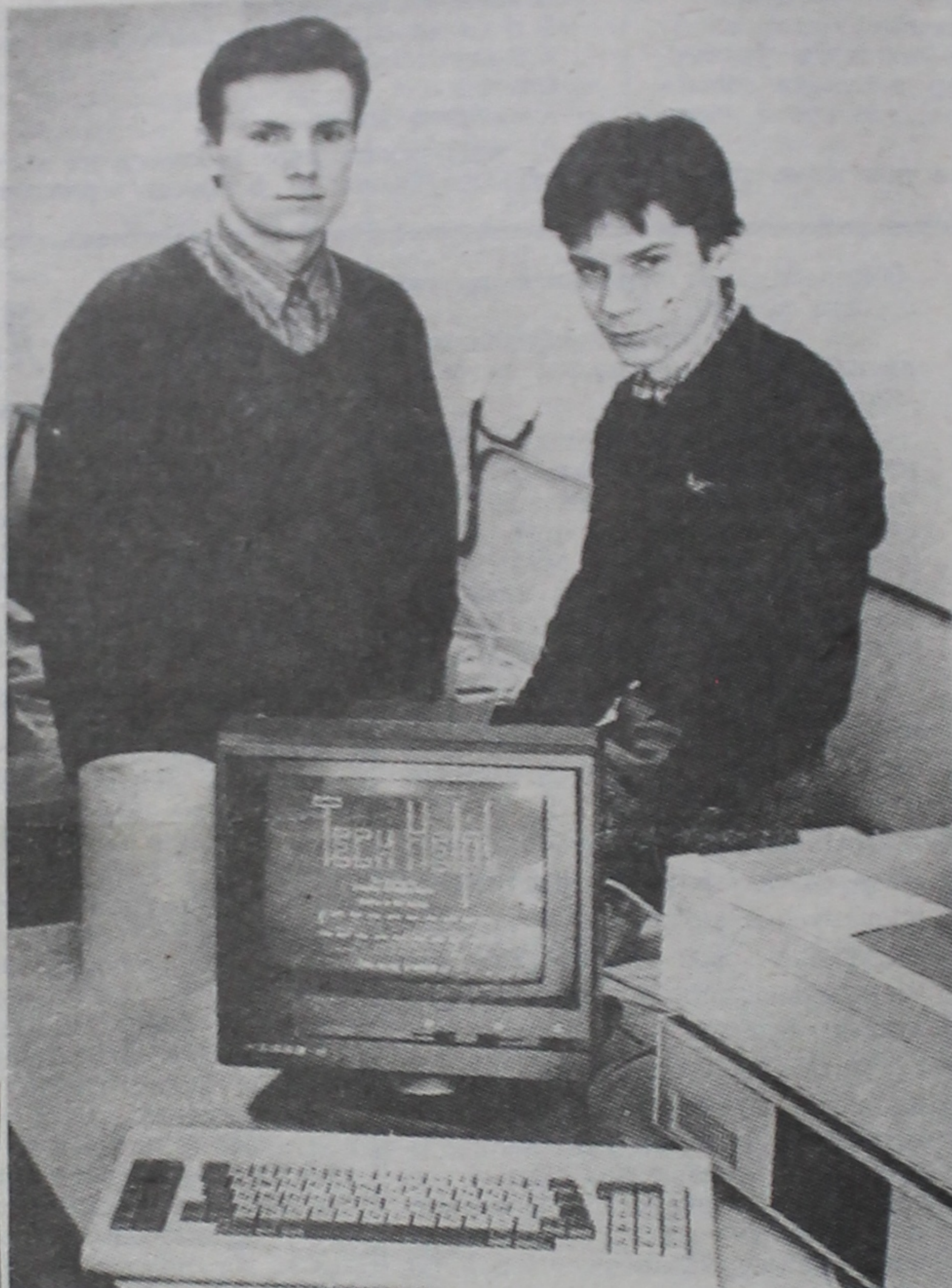
З кожным годам паліпшаецца тэхнічная аснашчанасць нашага ўніверсітэта. У вучэбным працэсе ўсё шырэй выкарыстоўваюцца персанальныя ЭВМ.

А яшчэ мы запрашаем абітурэнтаў на «Дзень адкрытых дзвярэй», які адбудзецца на ўніверсітэце 23 мая г. г. На ім вы зможаце атрымаць адказы на ўсе цікавыя Вас пытанні.