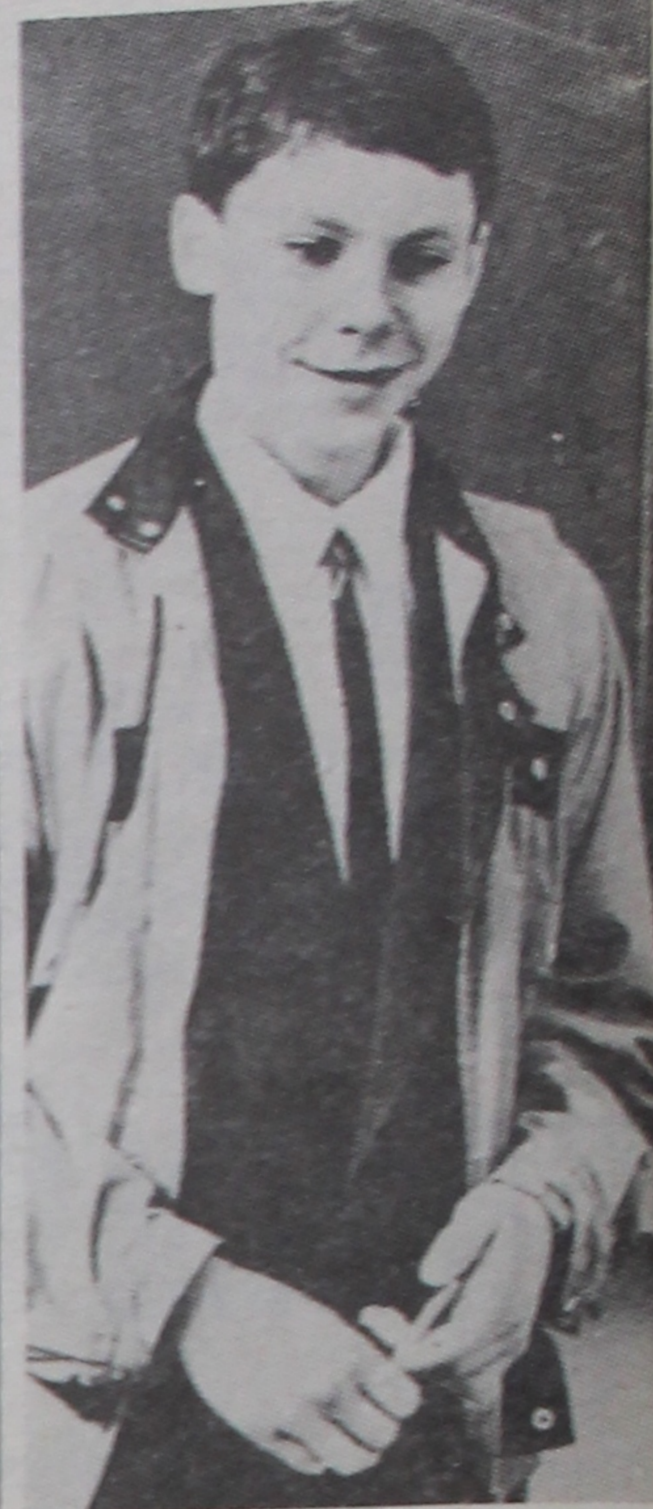
НА ЗДЫМКАХ: Абітурыенты дзятэрмінова здаюць пісьмовы экзамен па роднай мове і літаратуры. Цяжкая задача. Як не парадавацца, калі атрымаў добрую адзнаку?