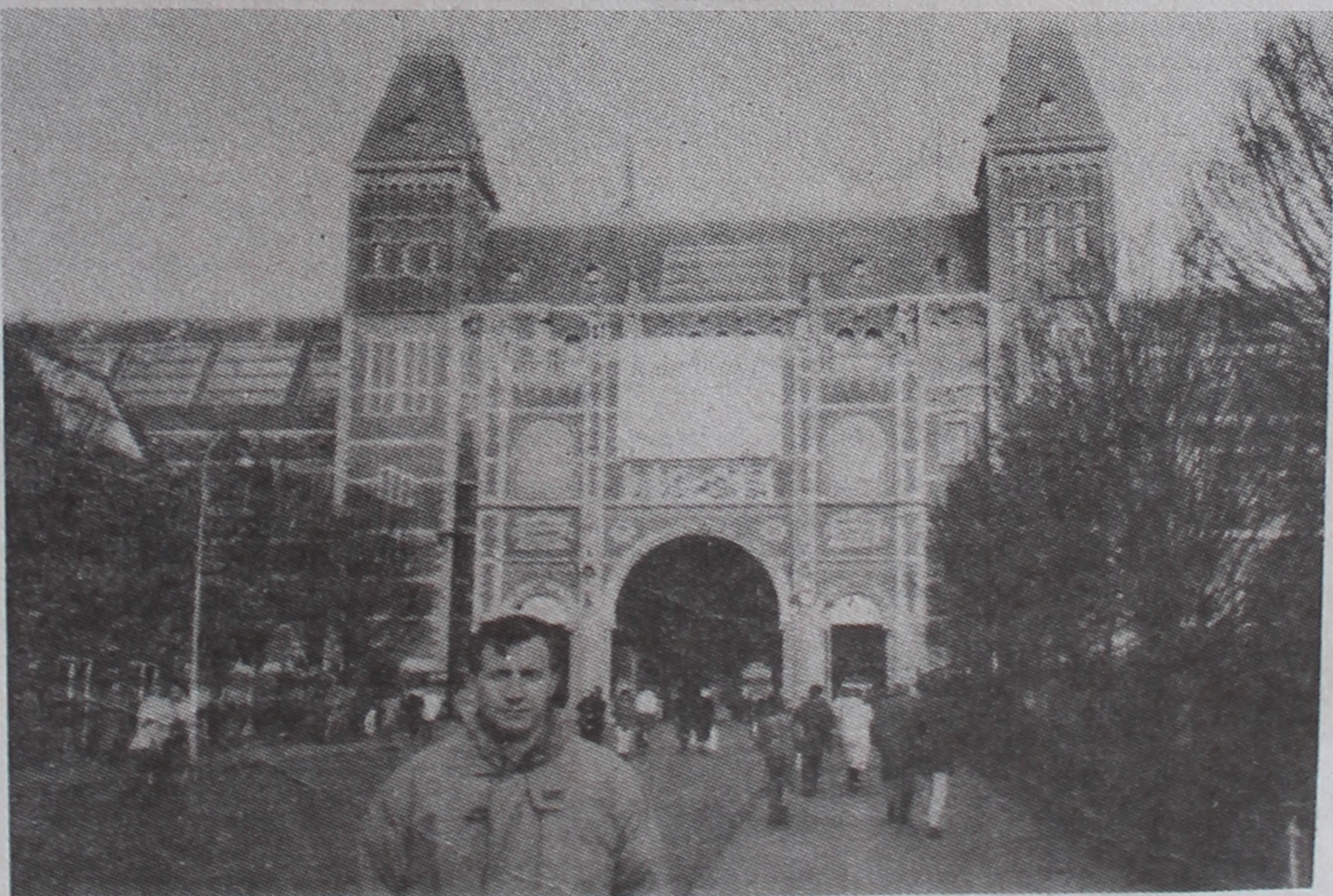
НА ЗДЫМКУ: каля будынка нацыянальнага музея Нідэрландаў.

А МСТЭРДАМ лічыцца буйным турысцкім цэнтрам. Сёння ў ім больш 50-ці музеяў і 70-ці тэатраў. Мне не хапіла часу і грошай, каб пабыць у кожным з іх. Але ўбачыў усё ж нямала. Вельмі спадабаліся калекцыі музея