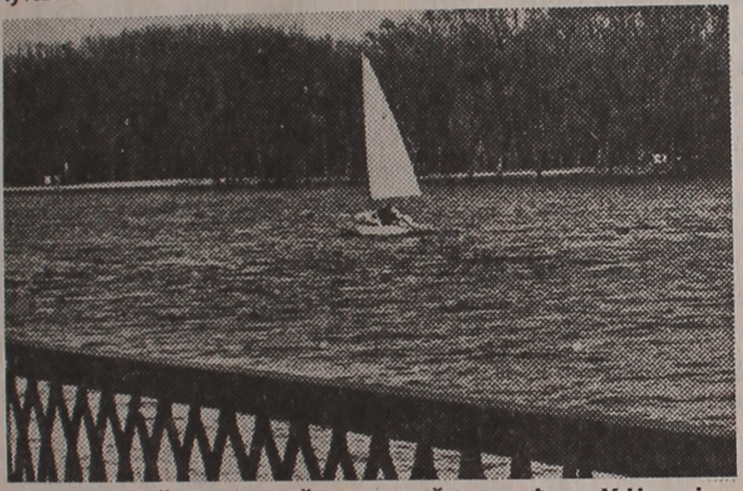
НА ПЕРШАЙ ВЯСНОВАЙ ТРЭНІРОЎЦЫ.