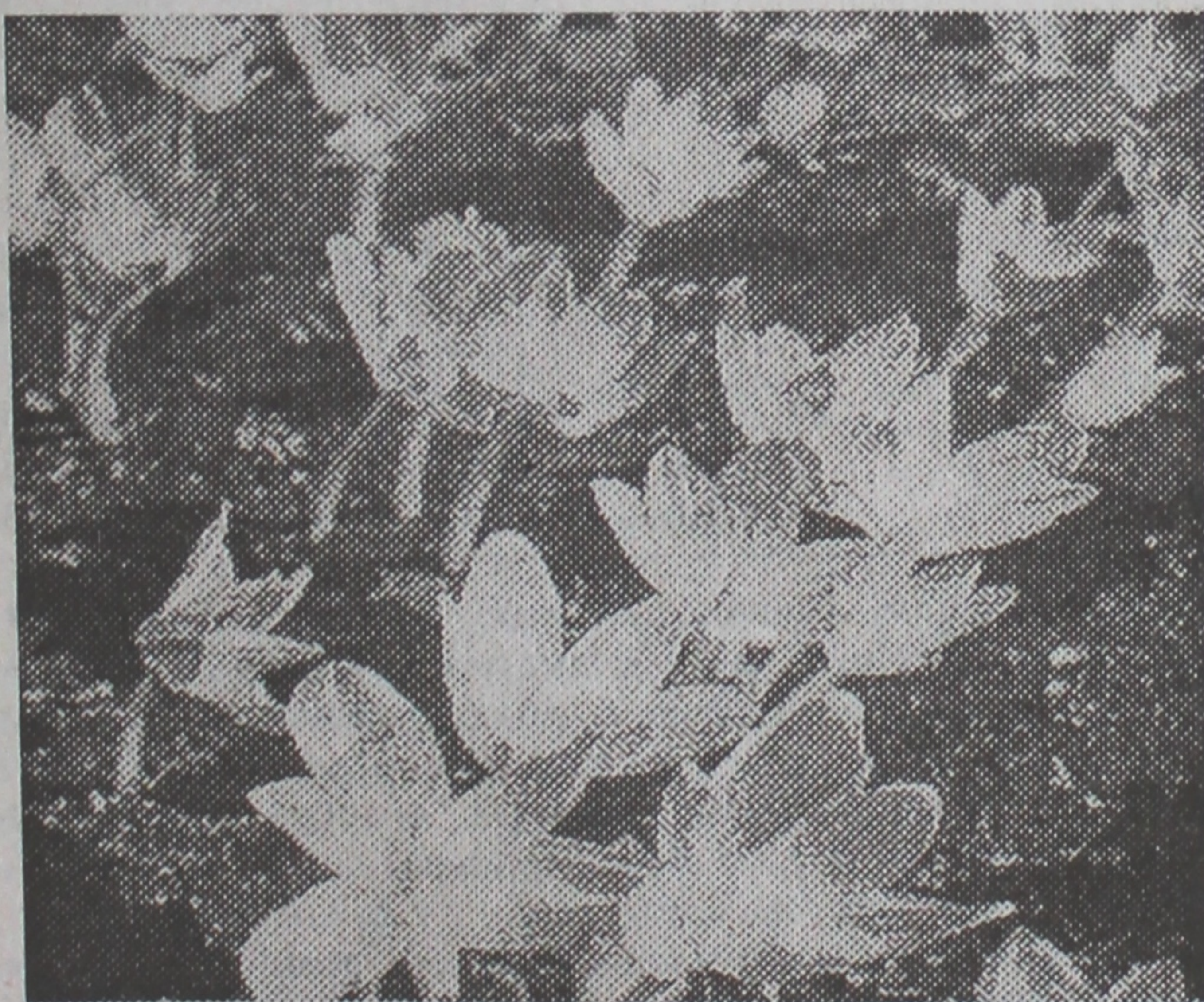
ПЕРШЫЯ ВАСНОВЫЯ КВЭТКІ.

Сям'я Уладзіміра Сямёнавіча Дайнэкі, які раптоўна і заўчасна пайшоў з жыцця, выказвае шчырую падзяку кіраўніцтву, выкладчыкам і супрацоўнікам універсітэта за матэрыяльную і маральную падтрымку ў час нашага гора.