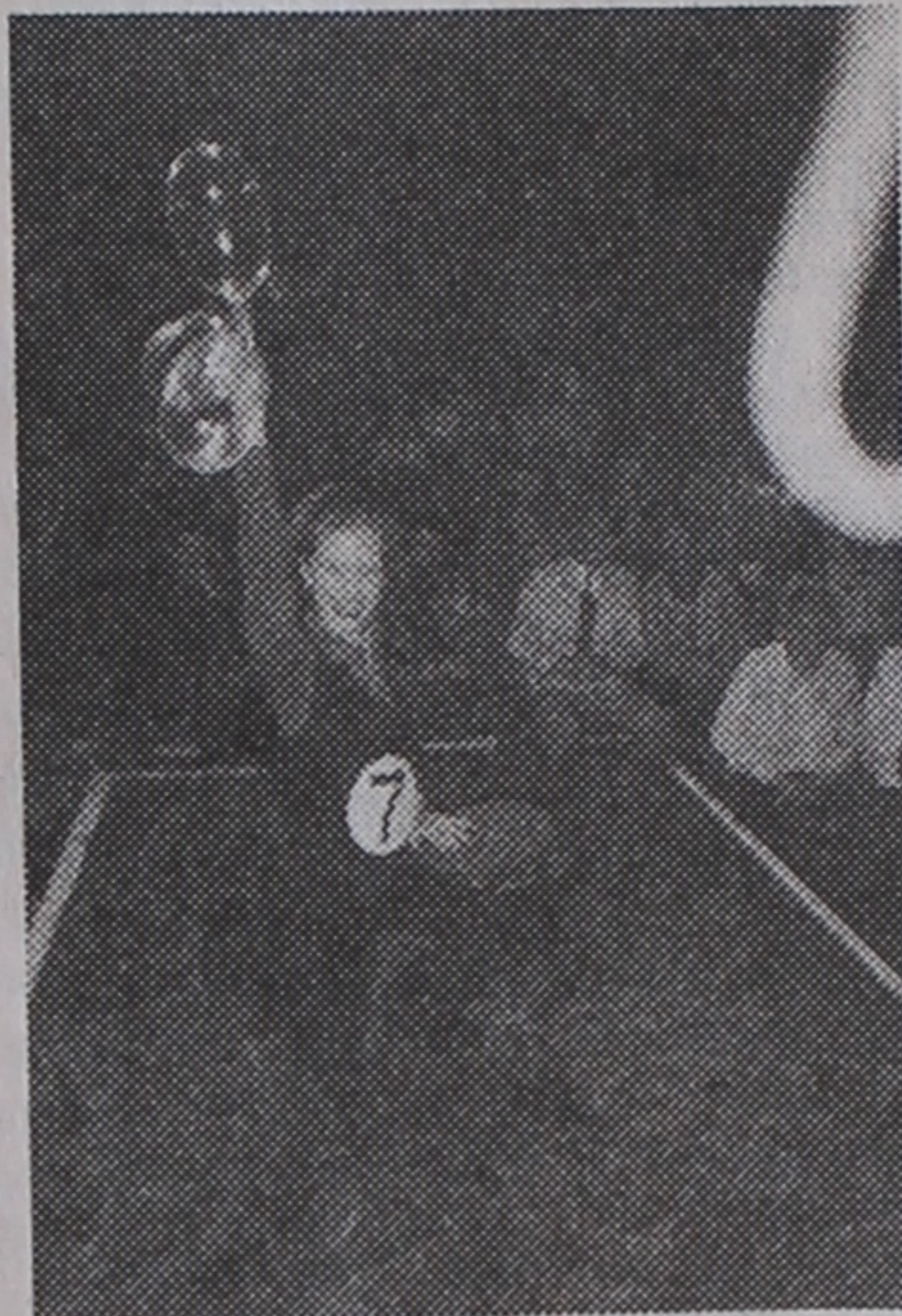
На фотаконкурсе гэты здымак названы журы лепшым. Яго аўтар -- Дзмітрый Васькаўцоў.

"Настрадамусам" і атрымаў прыз -- кнігі; Д.Васькаўцоў -- "мэтрам" фотаздымкаў, за