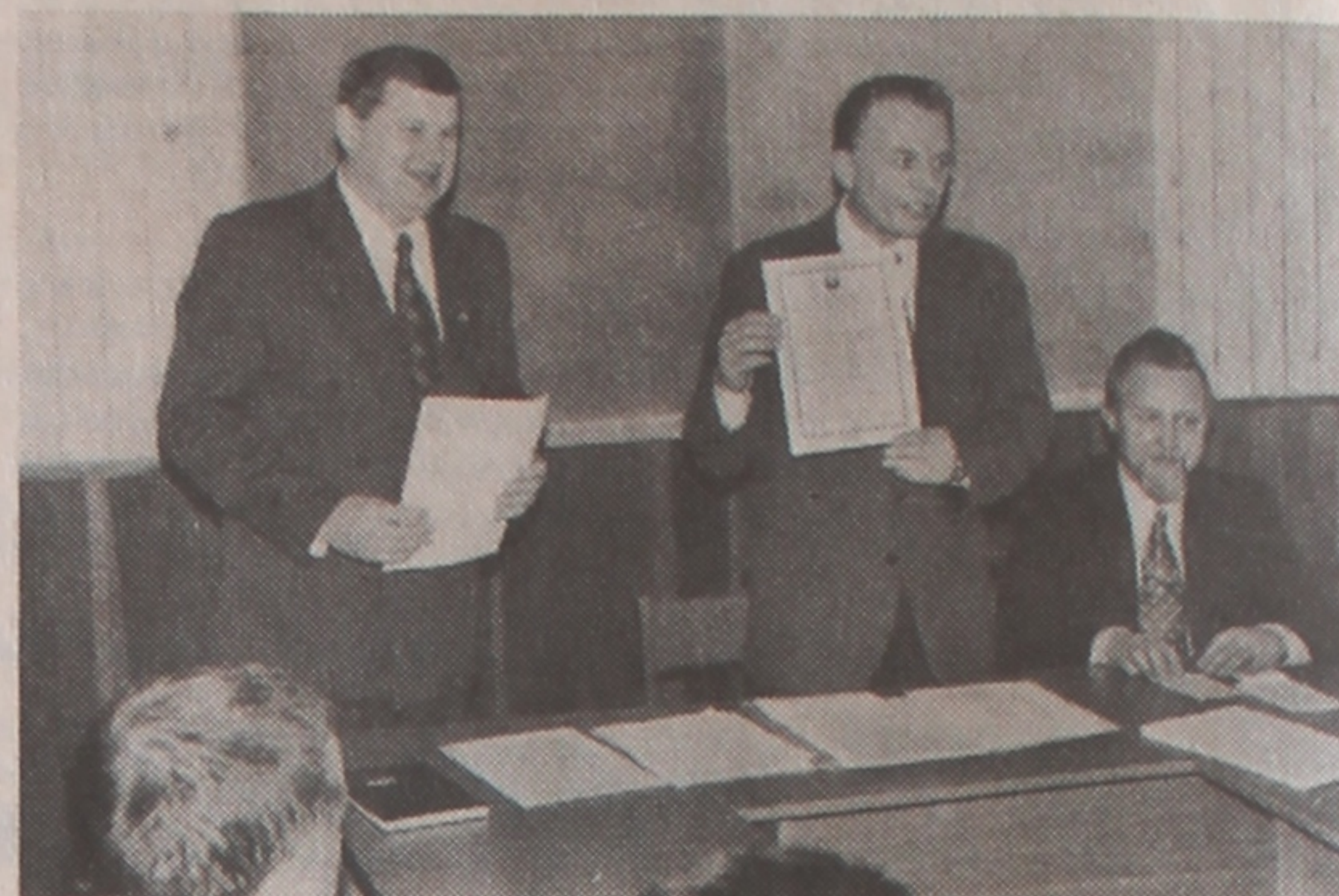
УРУЧЭННЕ ПАСВЕДЧАННЯ АБ АТЭСТАЦЫІ УНІВЕРСІТЭТА

Н.04.01.00 Біялогія Н.04.01.01 Заалогія Н.04.01.02 Батаніка Н.04.01.04 Фізіялогія чалавека і жывёлін Н.04.01.05 Біяхімія