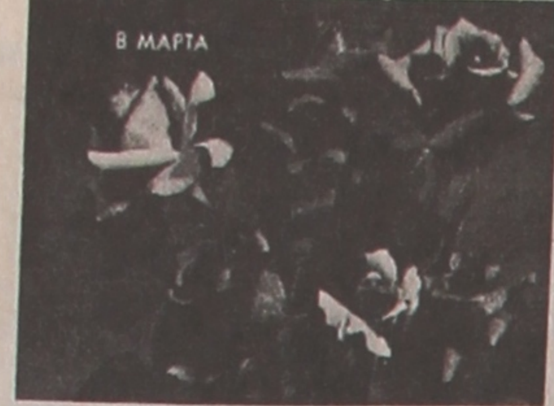
Рэктарат, грамадскія арганізацыі ўніверсітэта гарача і сардэчна

віншуюць выкладчыц, супрацоўніц і студэнтак з Днём жанчын, жадаюць ім моцнага здароўя, асабістага шчасця, плённай працы і паспяховай вучобы!