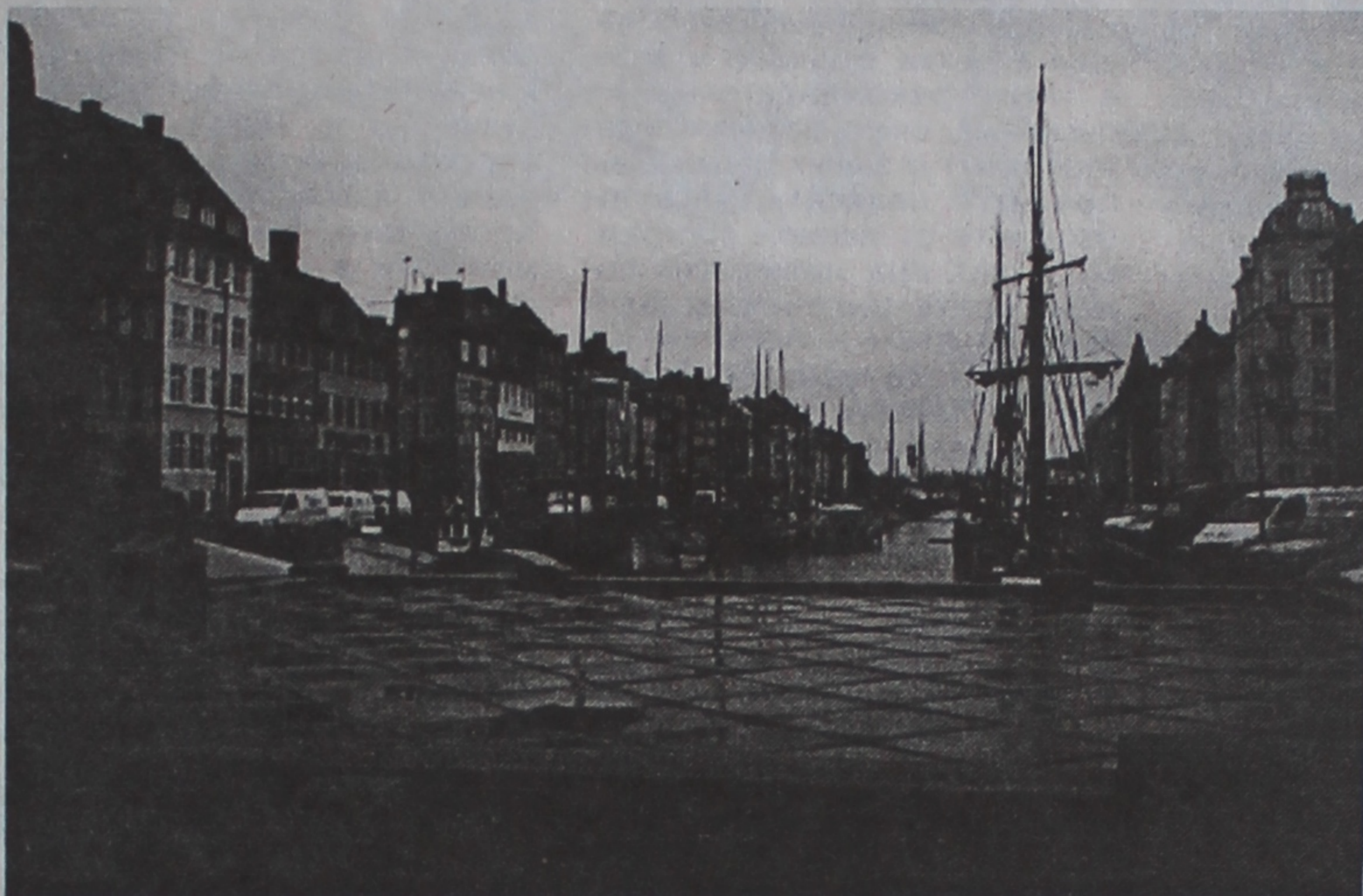
Одна из улиц Копенгагена.

ние чиновника амта и чиновника министерства абсолютно одинаково. Все они ничем не отличаются от частных служащих. Но очень ценят свою работу. "Я оказываю влияние на решения, могу самостоятельно планировать работу моего амта". Депутаты обладают высокой моралью, население предьявляет к ним повышенные требования. Поэтому дополнительные блага чиновник себе позволить не может.