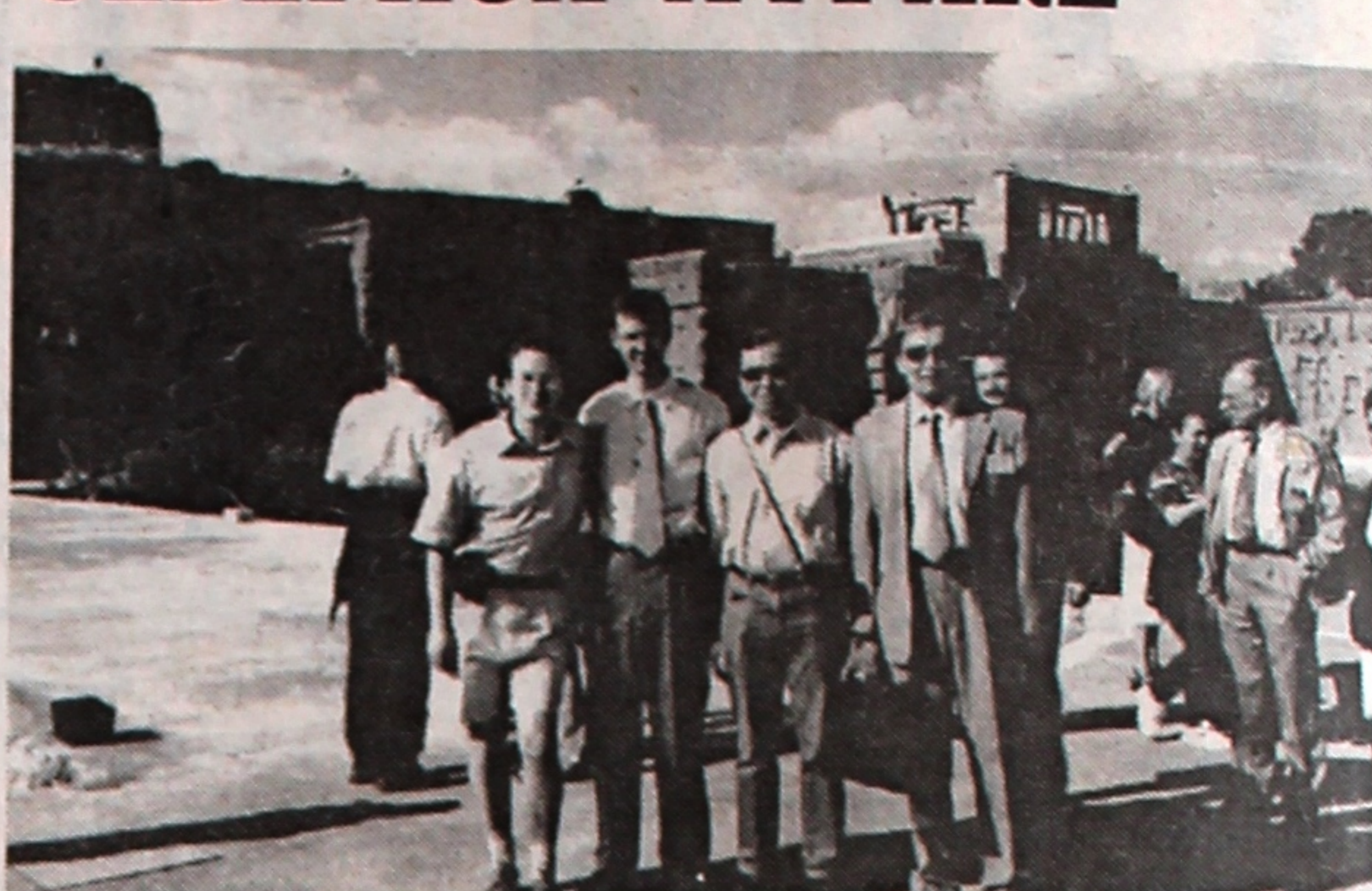
НА СНИМКЕ: гомельские ученые на экскурсии в Королевском дворце 15 века вместе с коллегами из других стран.