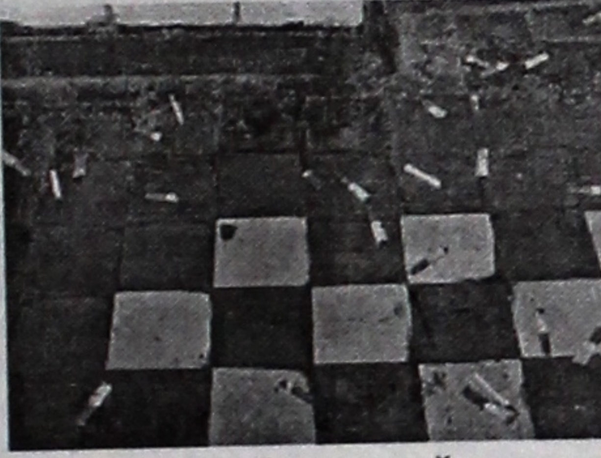
На снимке: комментарии излишни...(главный корпус, женский туалет на 5-м этаже).

Необходима еще более целенаправленная разъяснительная, воспитательная совместная работа кураторов, преподавателей, комитетов, общественных организаций, чтобы справиться с этим социальным злом.