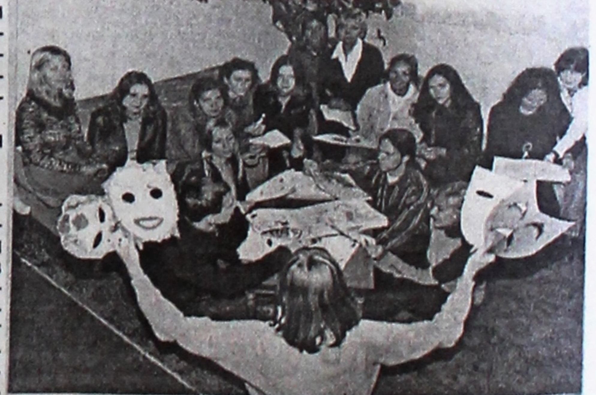
На снимке: студенты – члены психологического театра (руководитель Г.Г. Науменко).