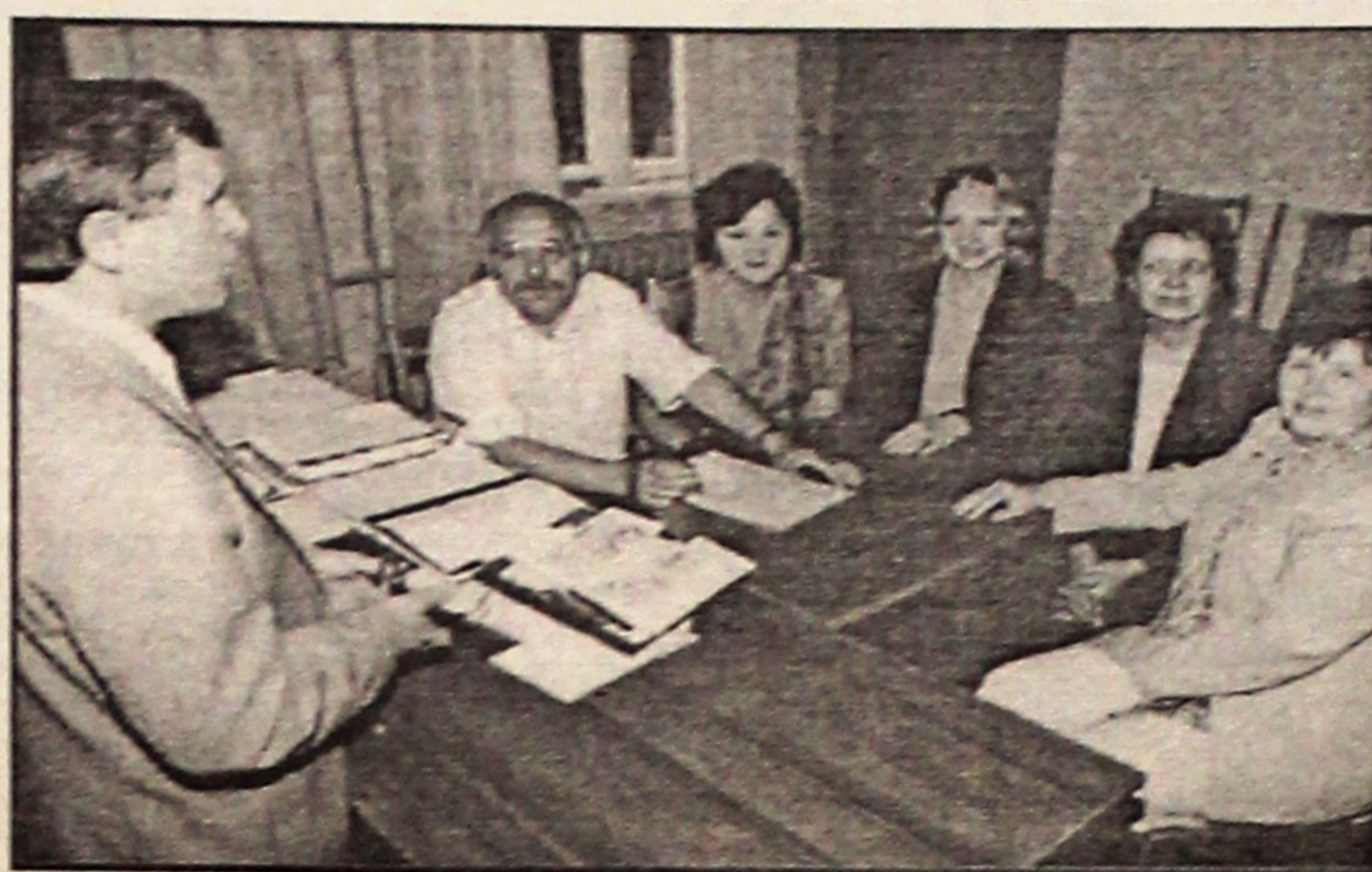
Ідзе абмеркаванне ходу летняй залікова-экзаменацыйнай сесіі на заочным факультэце.

функцыі гэтых саветаў, якія дзейнічалі на грамадскіх пачатках, уваходзілі падбор кандыдатаў і накіраванне іх на вучобу для падрыхтоўкі спецыялістаў, у якіх мелася патрэба ў раёне, або на прадпрыемстве ці ва ўстанове, стварэнне неабходных умоў для вучобы студэнтаў-заочнікаў і інш. Саветы садзейнічалі існавалі ў Брагінскім, Лоеўскім, Хойніцкім і іншых раёнах вобласці, на шэрагу прадпрыемстваў г. Гомеля. Аднак пад час грамадска-палітычных змен і пагаршэння сацыяльна-эканамічнага становішча ў народнай гаспадарцы ў другой палове 80-х гадоў саветы перасталі існаваць. Прычым таму з'явілася негатыўнае стаўленне кіраўнікоў прадпрыемстваў да праблемы падрыхтоўкі спецыялістаў на перспектыву.