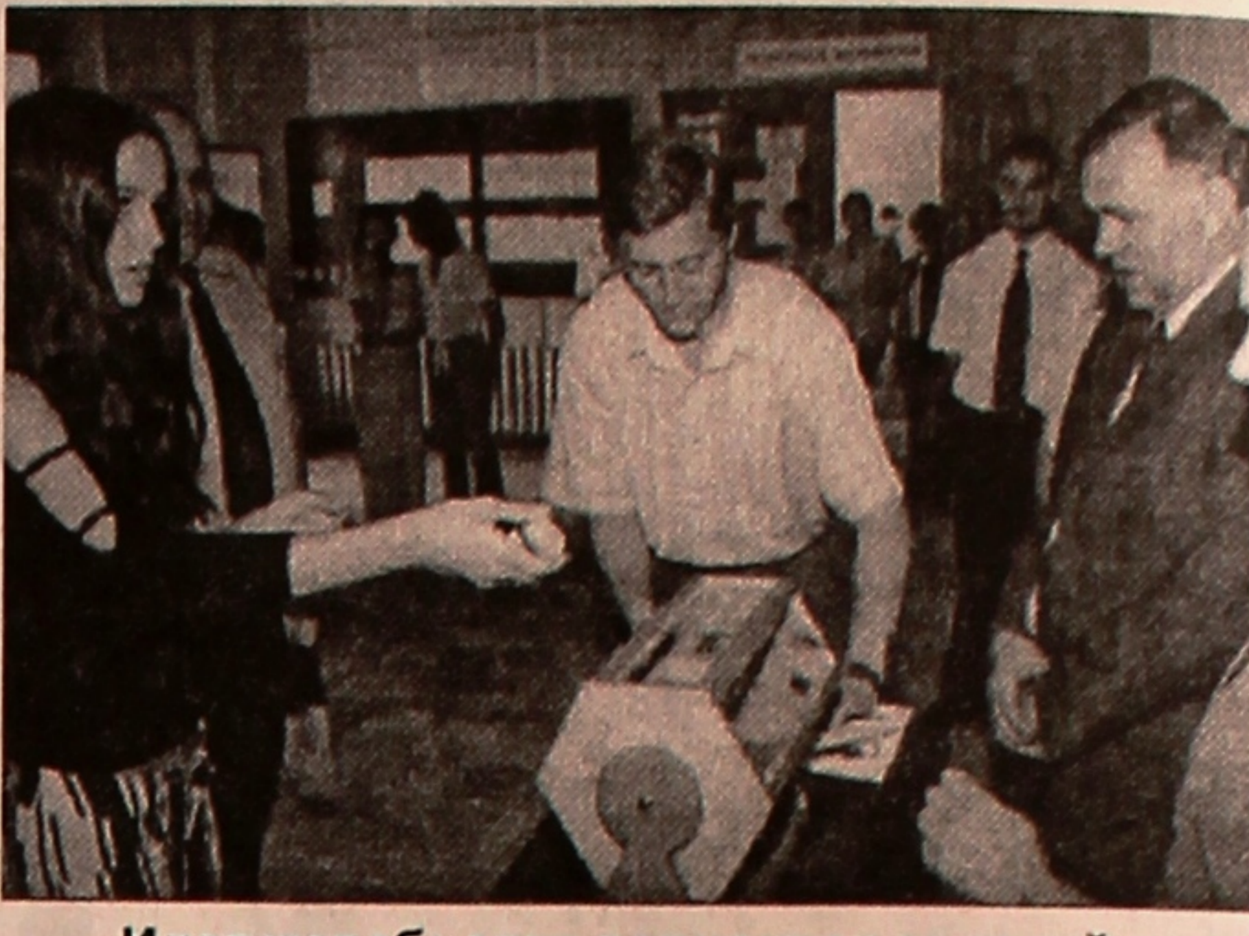
Идет жеребьевка вариантов заданий для вступительных испытаний.

На условиях общего конкурса зачислены на специальность «Белорусская филология и английский язык» абитуриенты, набравшие 18 баллов; на «Биологию» – 17; на «Русскую филологию» и «Белорусскую филологию» – 16; «Географию» и «Физичес-