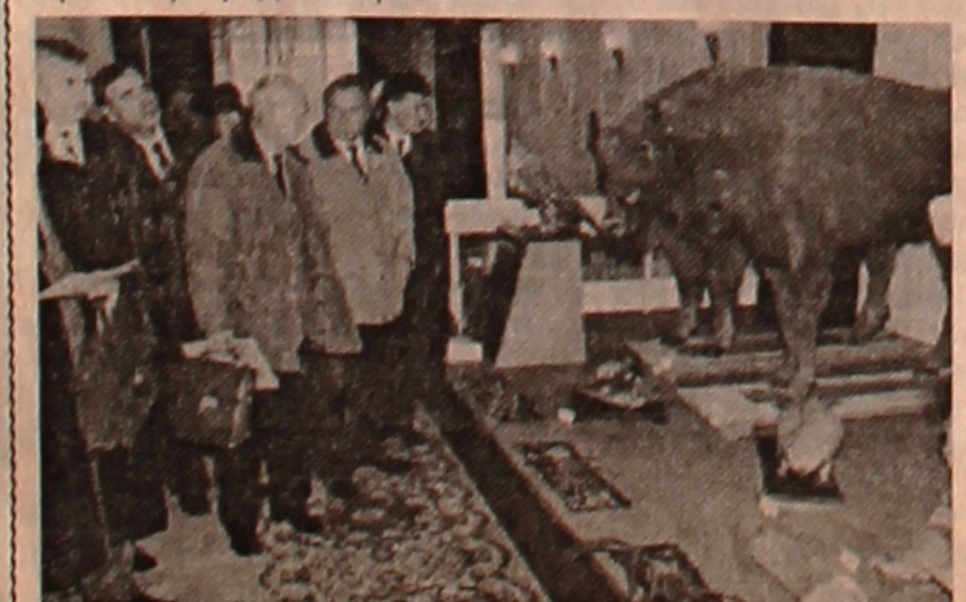
На снимке: участники семинара во Дворце студентов «Юбилейный» знакомятся с выставкой «Животный мир Беларуси».

В целом на заседании была дана положительная оценка идеологической работе, проводимой среди студентов ГГУ. В то же время было указано на недостатки, имеющие место в ее организации и проведении, над устранением которых еще предстоит работать.