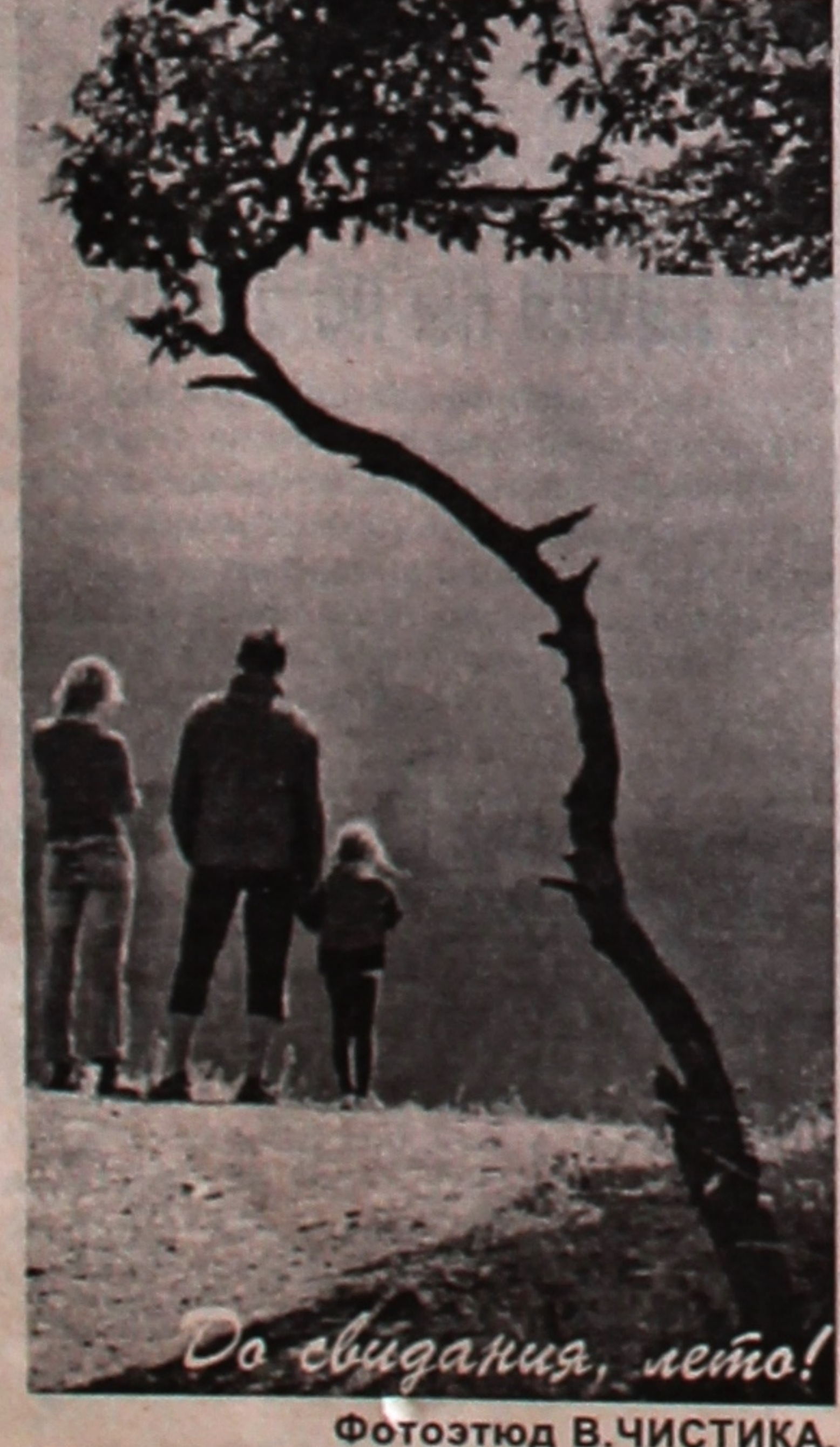
До свидания, лето! Фотозъюд В.ЧИСТИКА.

аб'яўляе конкурс на заміяшчэнне вакантных пасадак на 5-гадовы тэрмін па кафедрах: - рускага, агульнага і славянскага мовазнаўства – заг. кафедры, дацэнта (3), асістэнта; - беларускай мовы – дацэнта; - беларускай літаратуры – дацэнта; - тэорыі і практыкі англійскай мовы – старшага выкладчыка; - эканомікі і кіравання вытворчасцю – дацэнта, асістэнта; - давузаўскай падрыхтоўкі і прафарыентацыі – дацэнта; - лёгкай атлетыкі і лыжнага спорту – дацэнта. Тэрмін падачы заяў – не пазней 1 месяца з дня апублікавання паведамлення. Заявы накіроўваць на адрас: 246019, г. Гомель, вул. Савецкая, 104. РЕКТАРАТ.