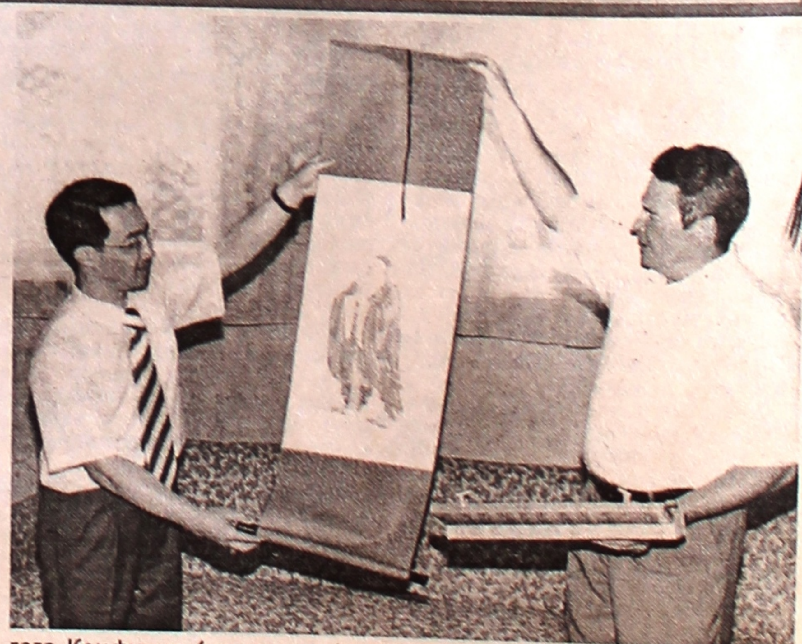
гога Конфуция (на снимке), которые займут достойное место в кабинете.