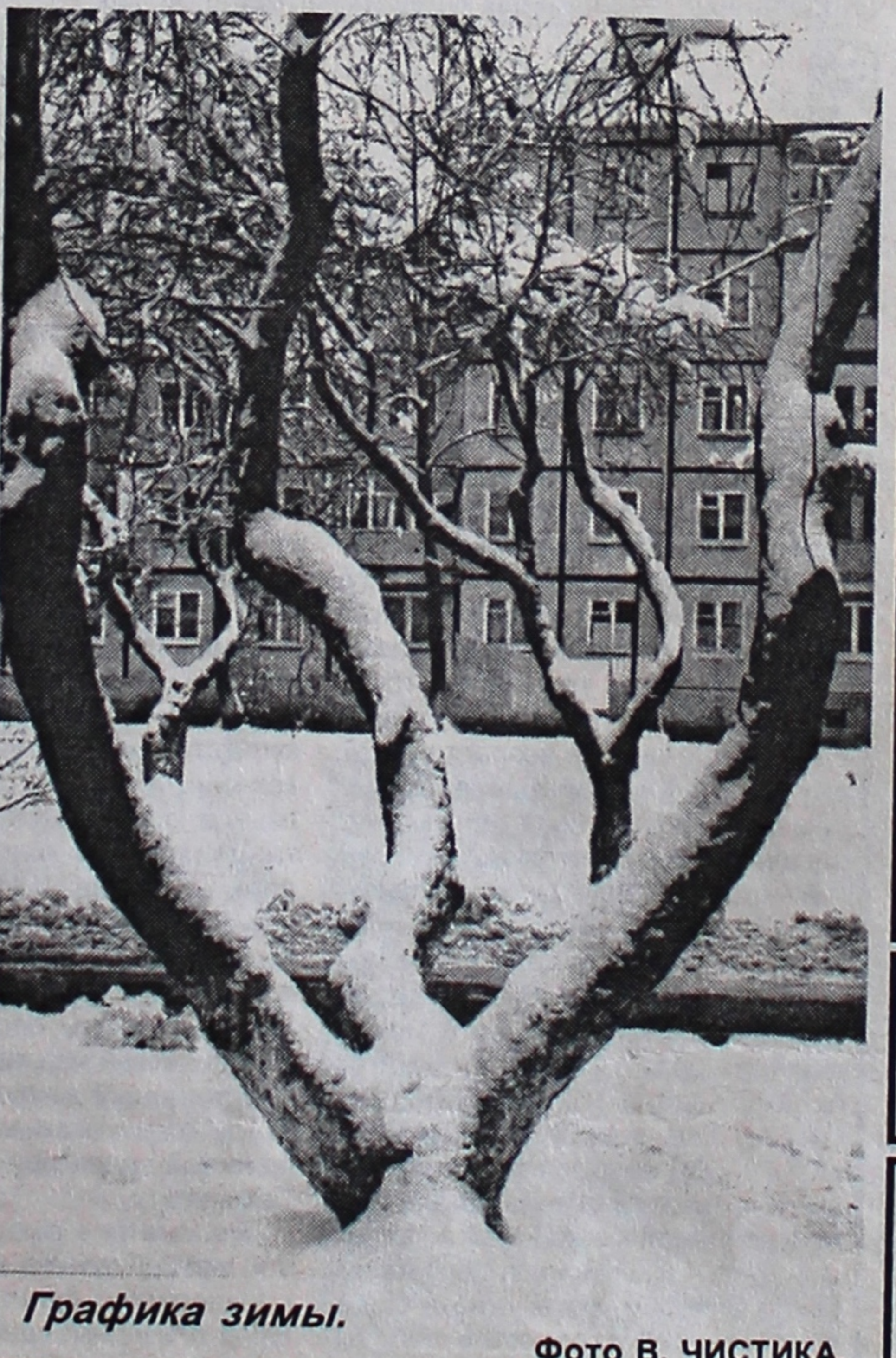
Графика зимы.

Юрий ПИЛЬКЕВИЧ, студент гр. БФЖ-33 филфака.