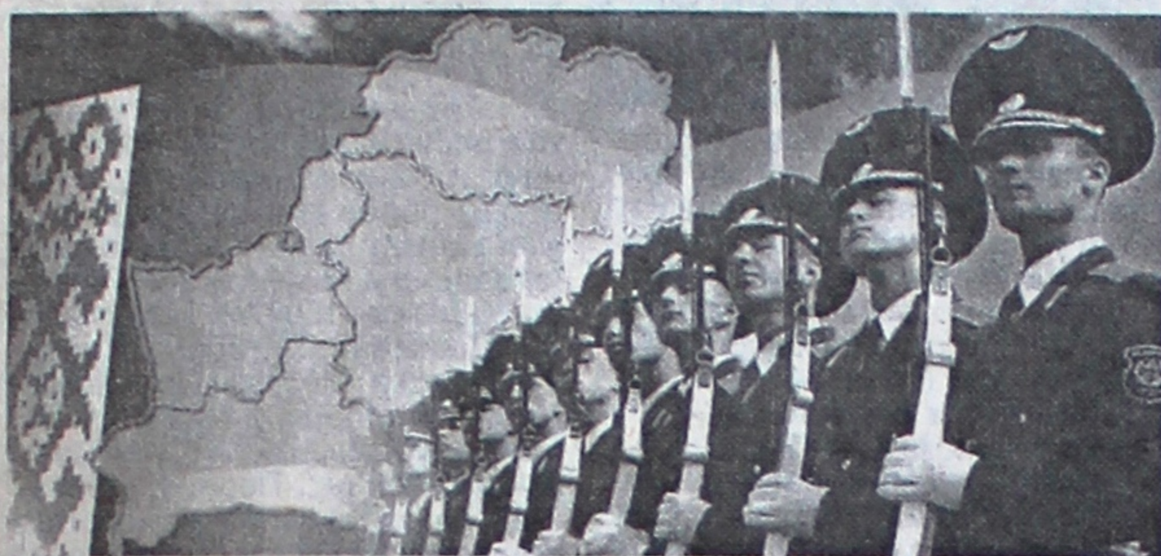
3 ДНЕМ АГАРОНЦАЙ АЙЧЫНЫ І ЎЗБРОЕННЫХ СІЛ РЭСПУБЛІКІ БЕЛАРУСЬ!

В честь 90-летия Вооруженных Сил Республики Беларусь Министерство образования Республики Беларусь с 15 по 24 фев-