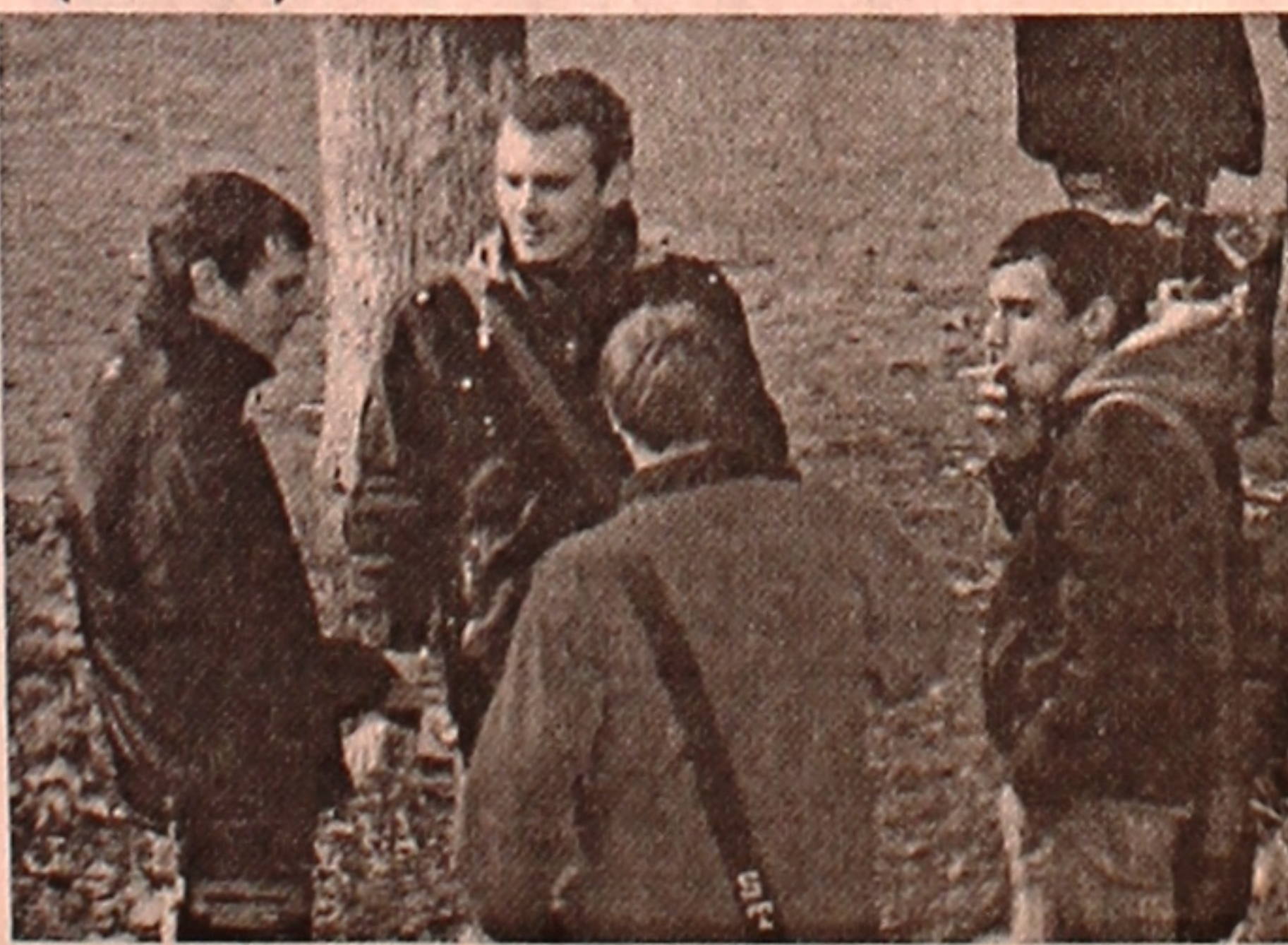
Несмотря на существующий в нашем вузе приказ о запрете курения в корпусах и на территории университета, такую наглядную карти-