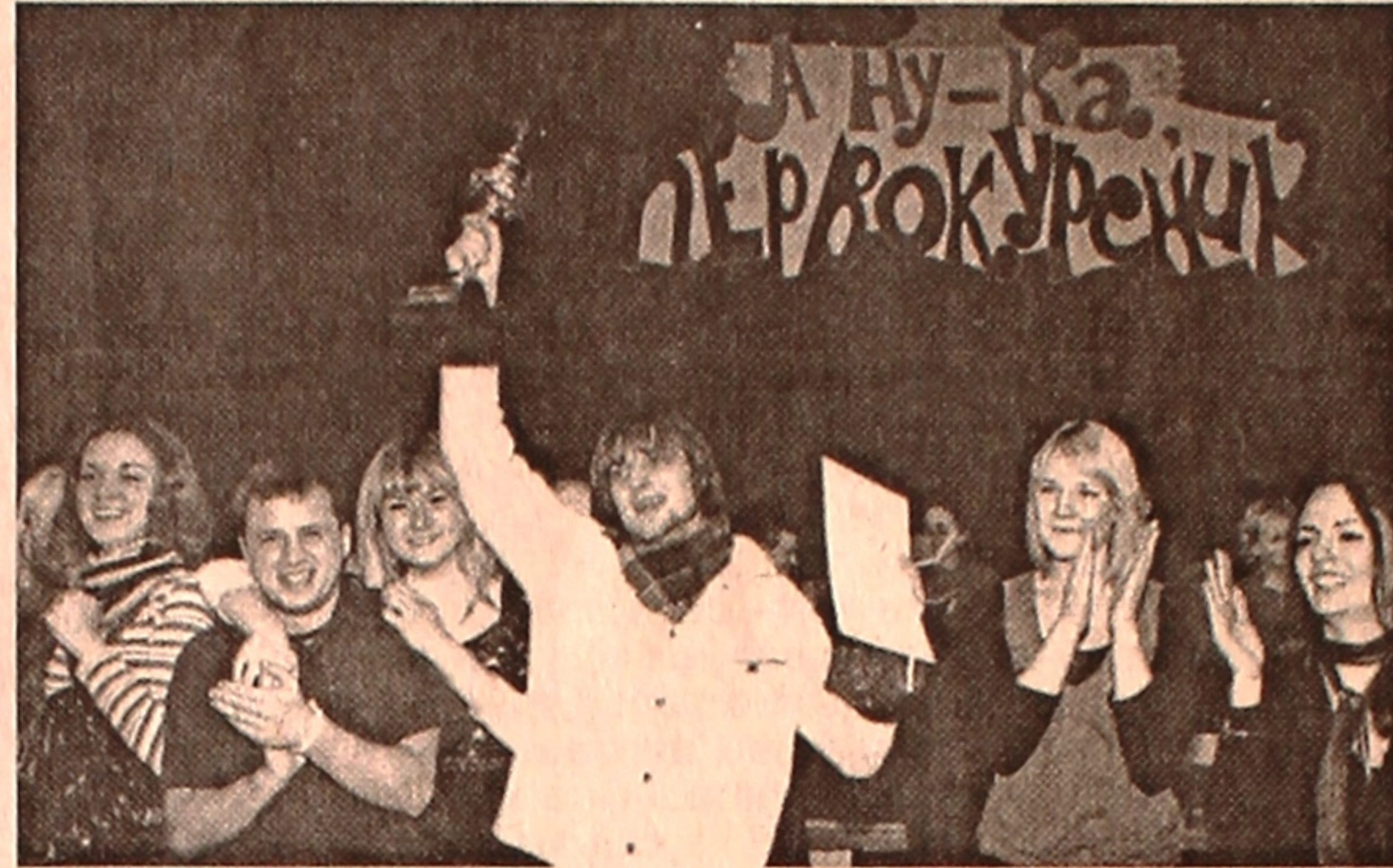
На снимке: победитель конкурса «А ну-ка, первокурсник – 2008» команда биофака.

По традиции мероприятие нашло поддержку ректората, профкома студентов, первичной организации БРСМ университета, и более 40 исполнителей самых ярких творческих номеров конкурса, его лауреаты в