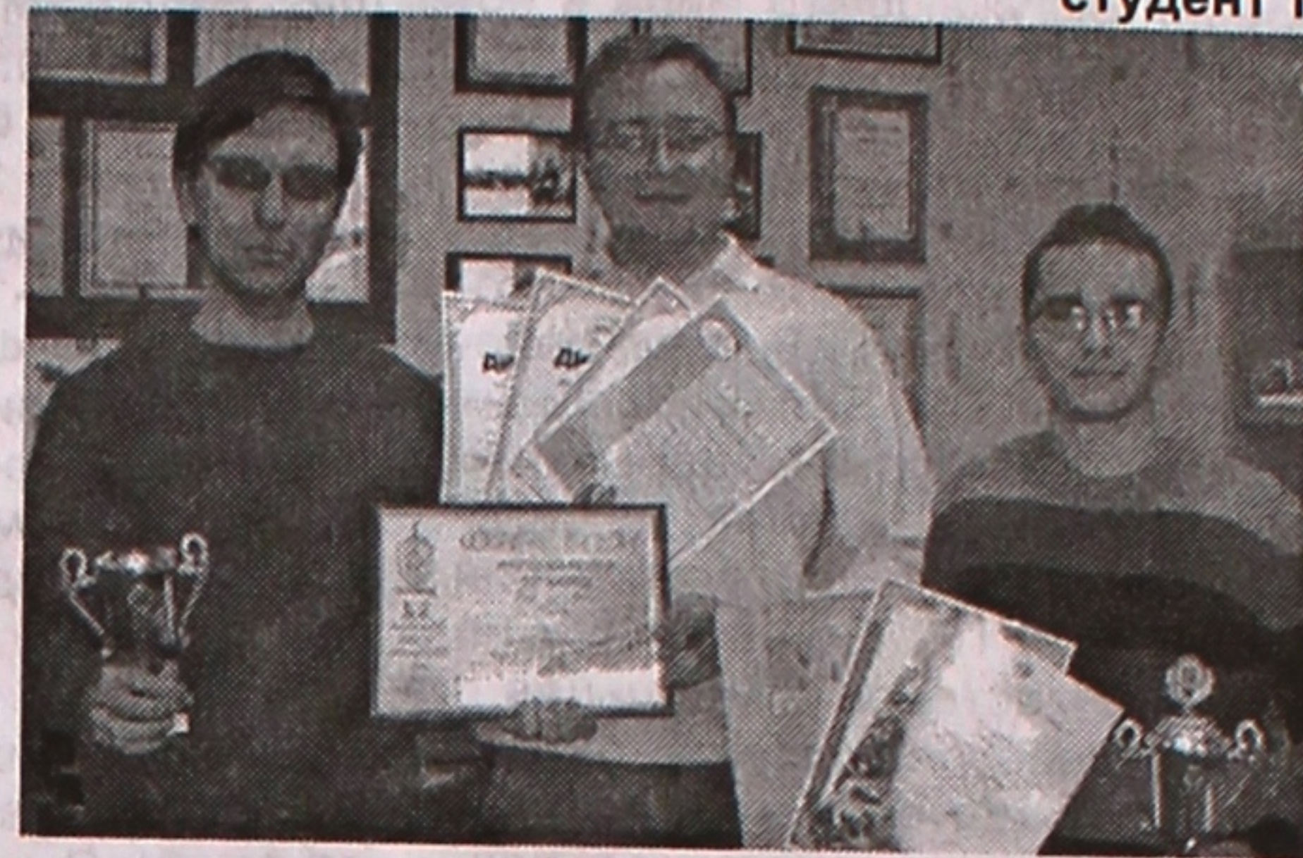
Ждем вас в нашем клубе