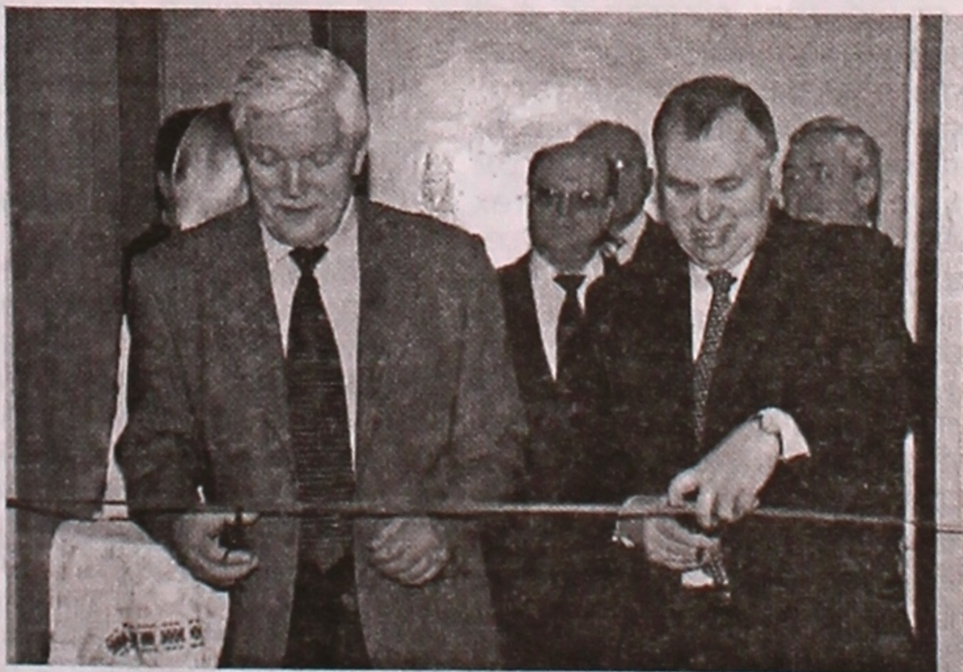
Центр русистики открывают посол А.А. Суриков и ректор ГГУ А.В. Рогачев.

Идея создания Центра принадлежит филологам-русистам ГГУ и нашла свое реальное воплощение благодаря руководству университета, поддержке местных органов власти, бескорыстной помощи Посольства Российской Федерации в Республике Беларусь. От него университет получил в подарок необходимое оборудование: современную компьютерную технику, дающую возможность работы в режиме online, 1,5 тысячи экземпляров научной, справочной, методической, художественной литературы на сумму около 20 миллионов рублей.