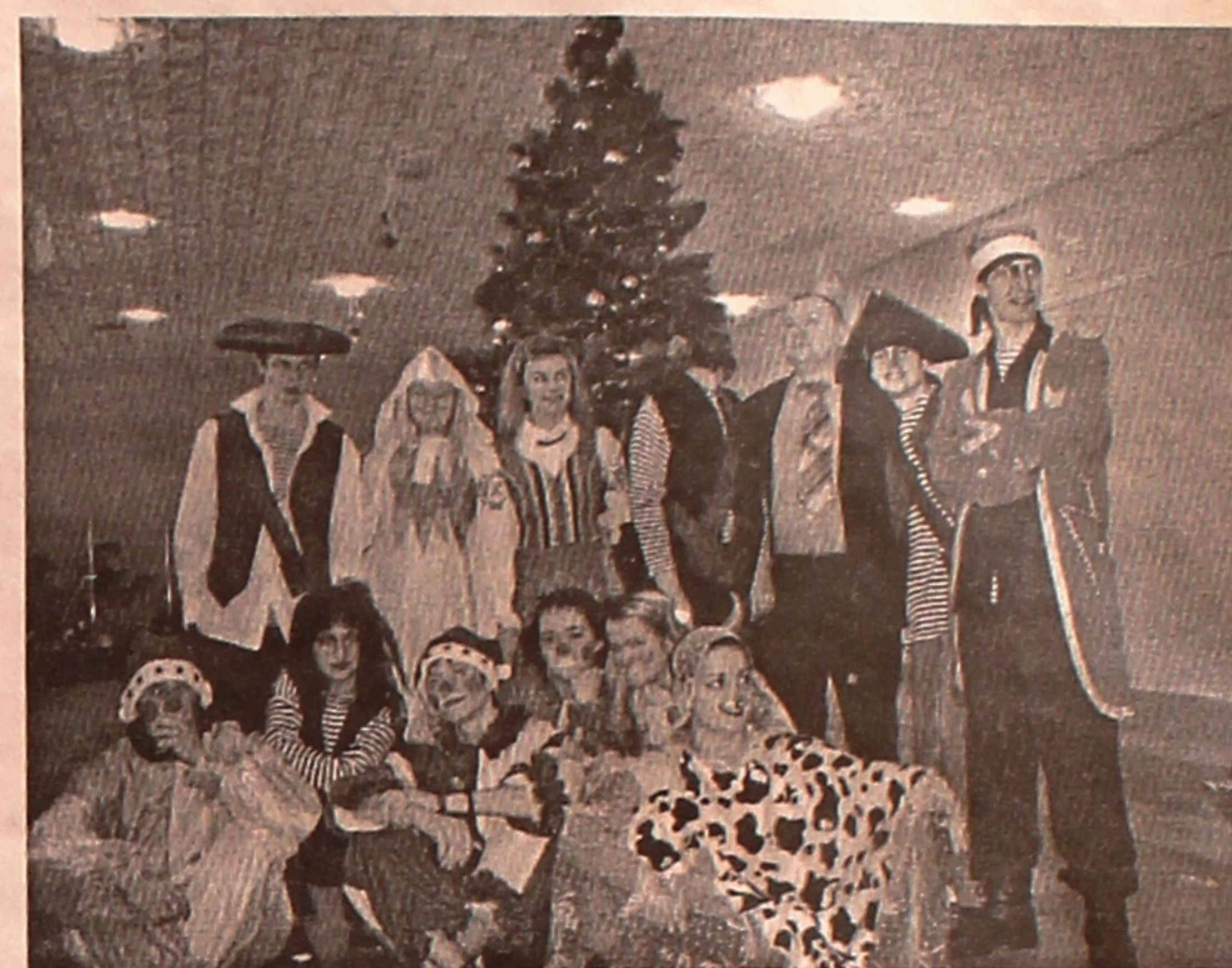
Самодельные артисты студенческого клуба в ролях сказочных героев новогоднего представления.