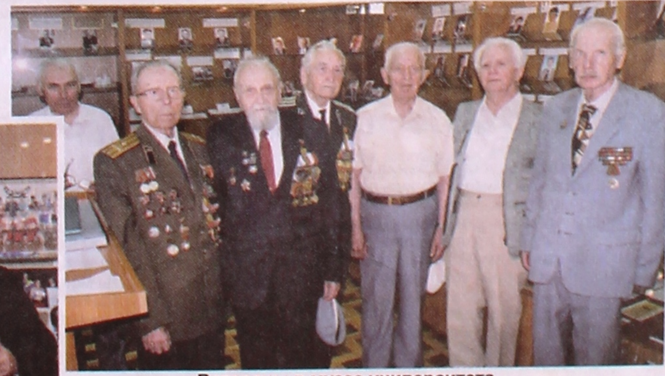
Ветераны в музее университета.