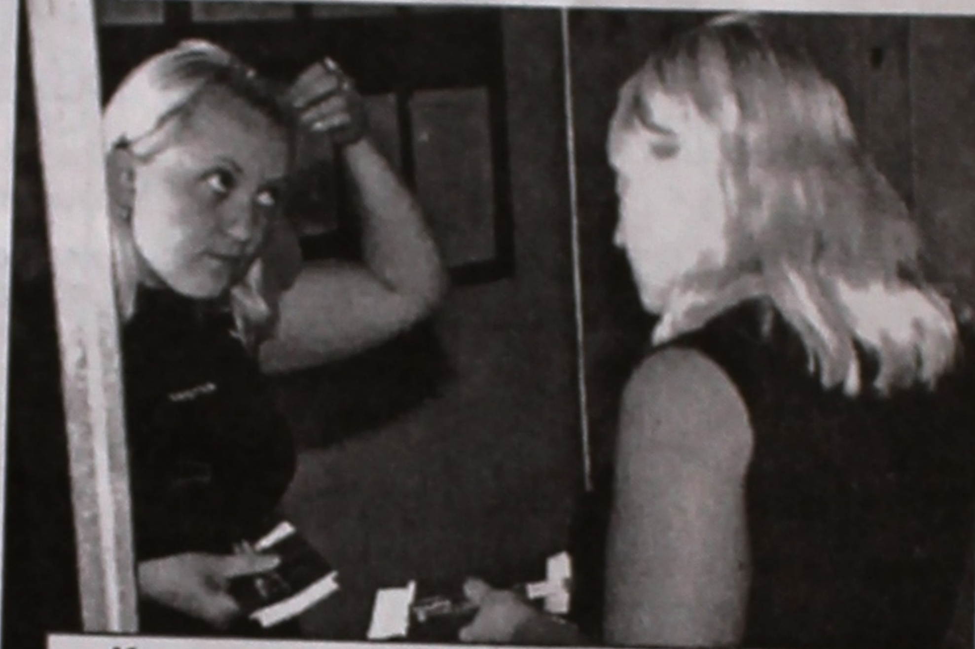
Красота и на тестировании нужна.