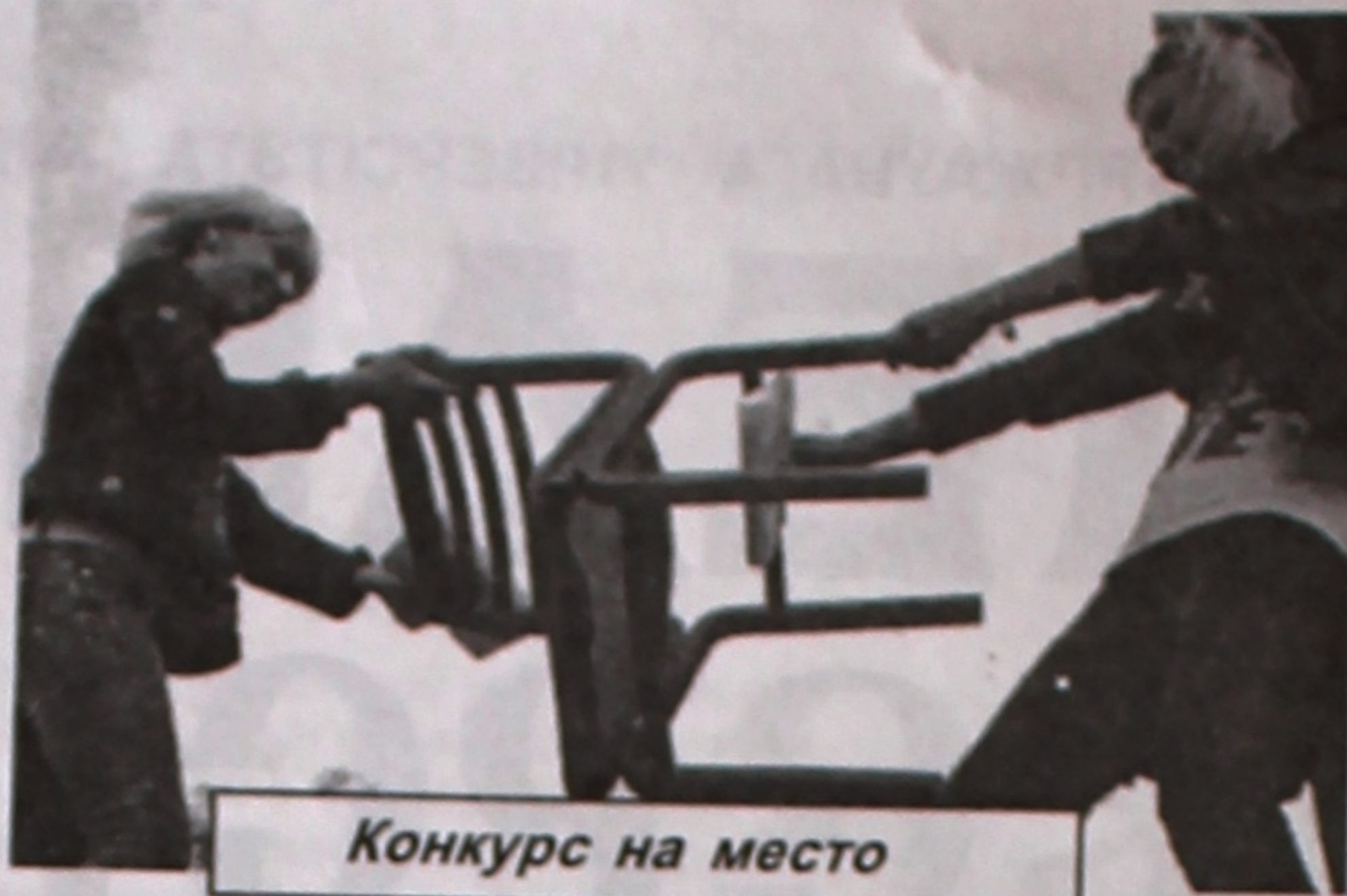
Конкурс на место