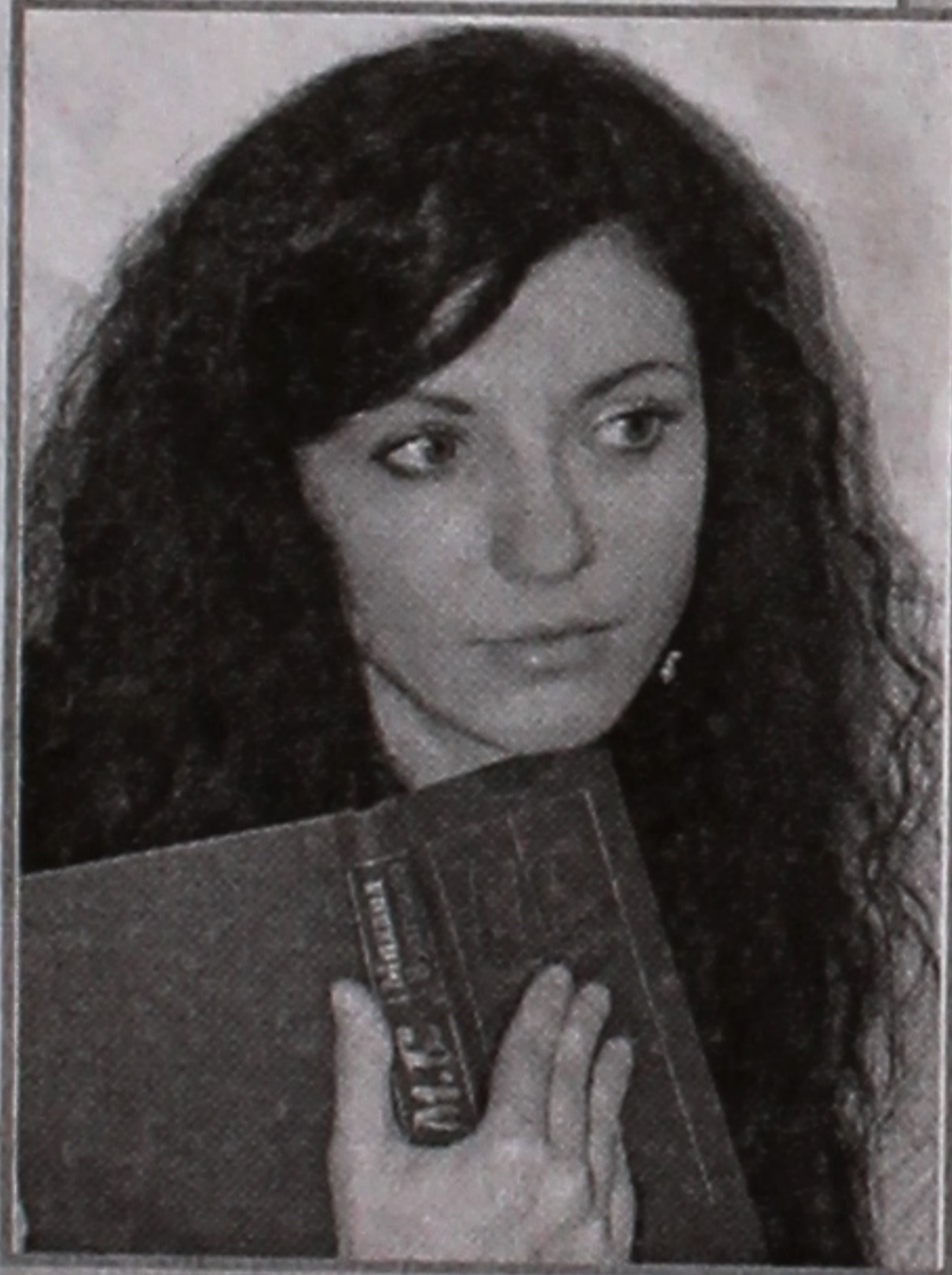
Записала Татьяна КОЗЕРОЖЕЦ.