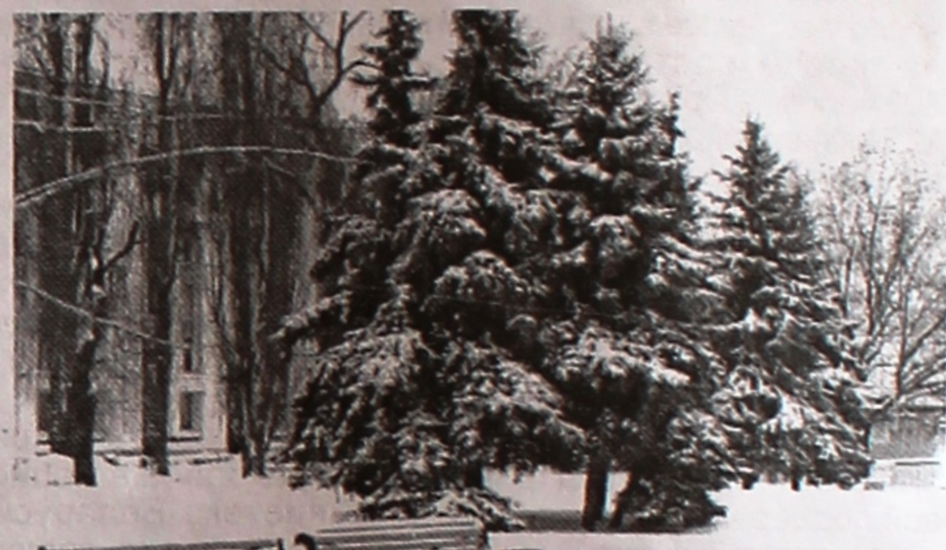
Зимнее безмолвие.

«Беларусь – спортивная страна» – под таким девизом в заречной зоне г. Гомеля прошла традиционная спартакиада по лыжным гонкам среди студентов вузов, учащихся ссузов и профтехучилищ. На дистанцию вышли свыше 700 юношей и девушек, чтобы показать класс на лыжне. Самыми быстрыми были студенты нашего университета: они заняли I-е место среди команд вузов.