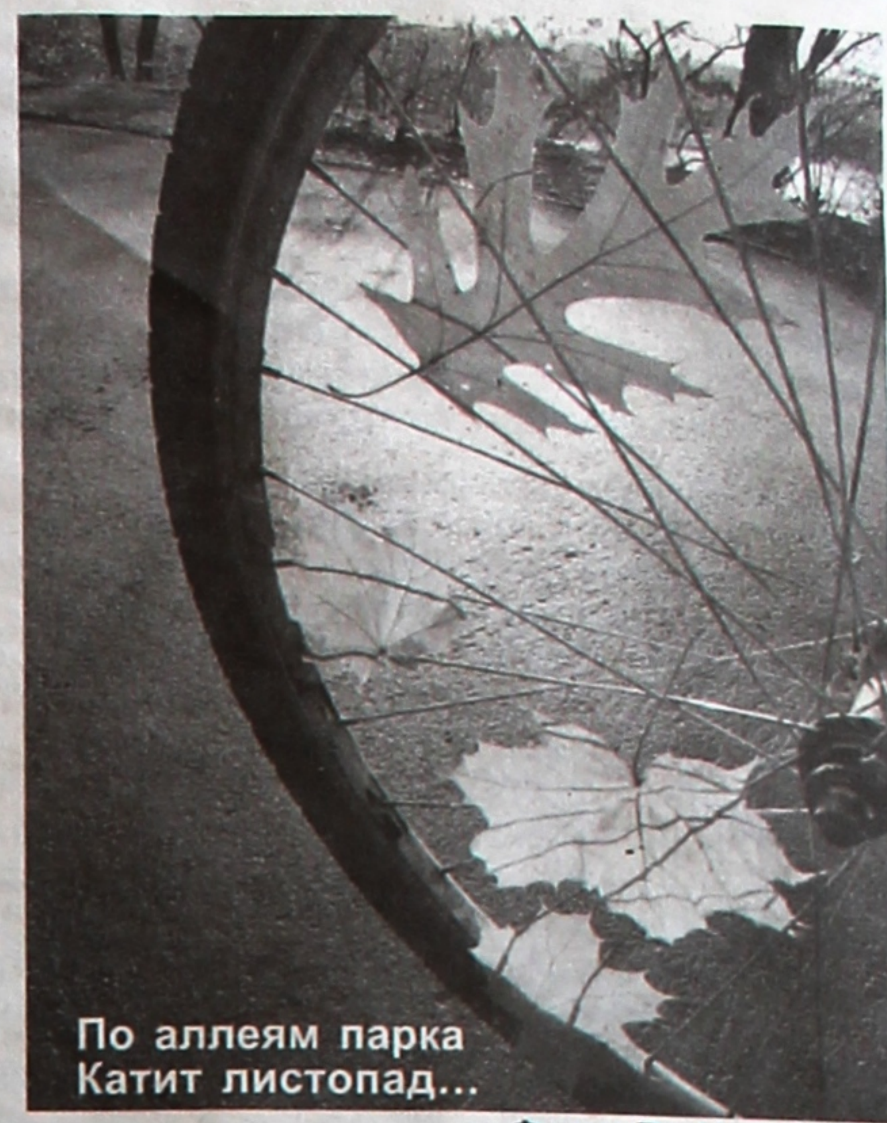
По аллеям парка Катит листопад...