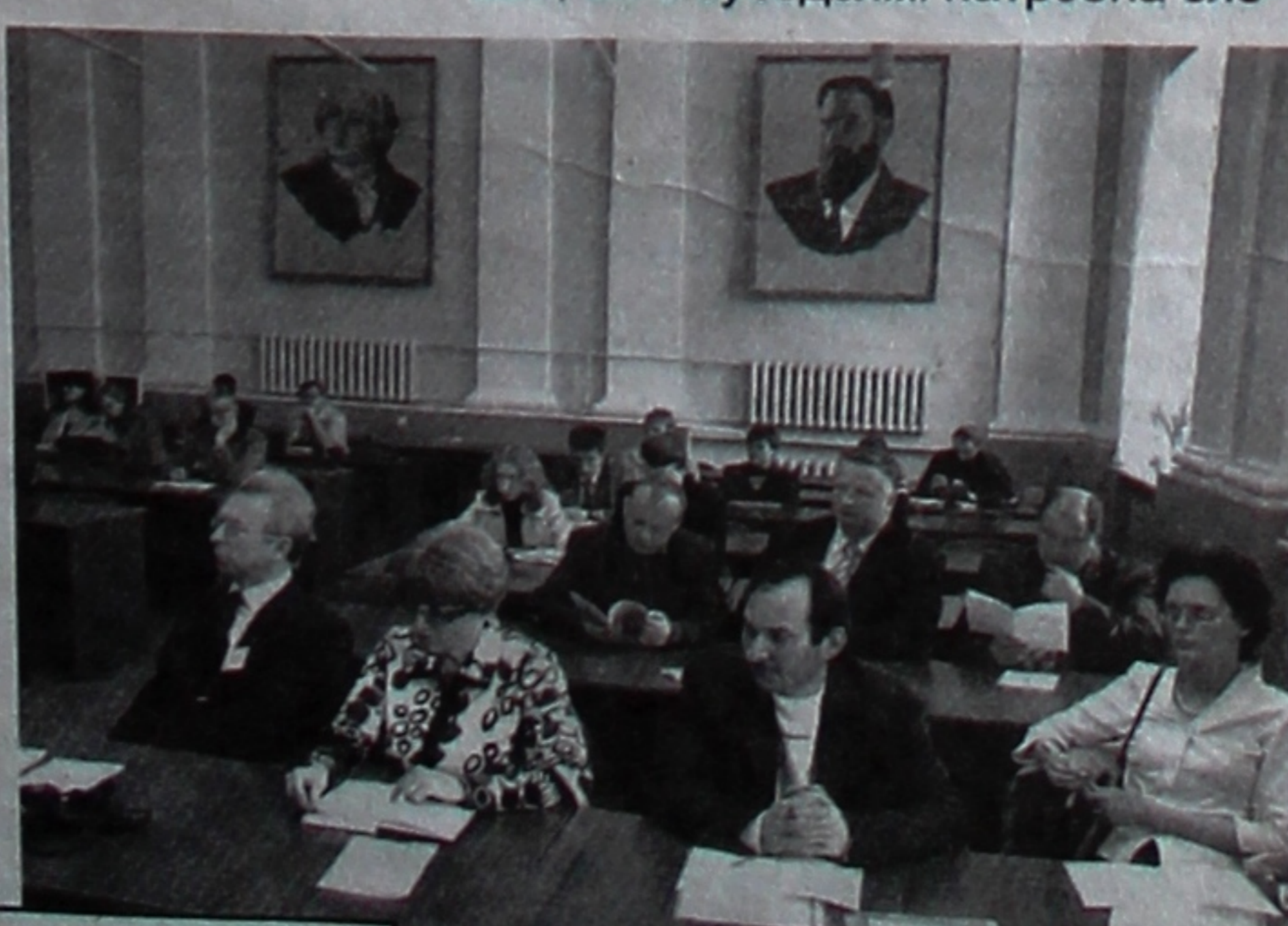
раваць і абмяркоўваць агульныя праблемы, узгадаў міжнародныя

практы, у якіх удзельнічае наш універсітэт. Такія канферэнцыі – адзін са шляхоў, што дапамагае ўмацоўваць і развіваць адносіны і сувязі паміж Беларуссю і суседнімі краінамі.