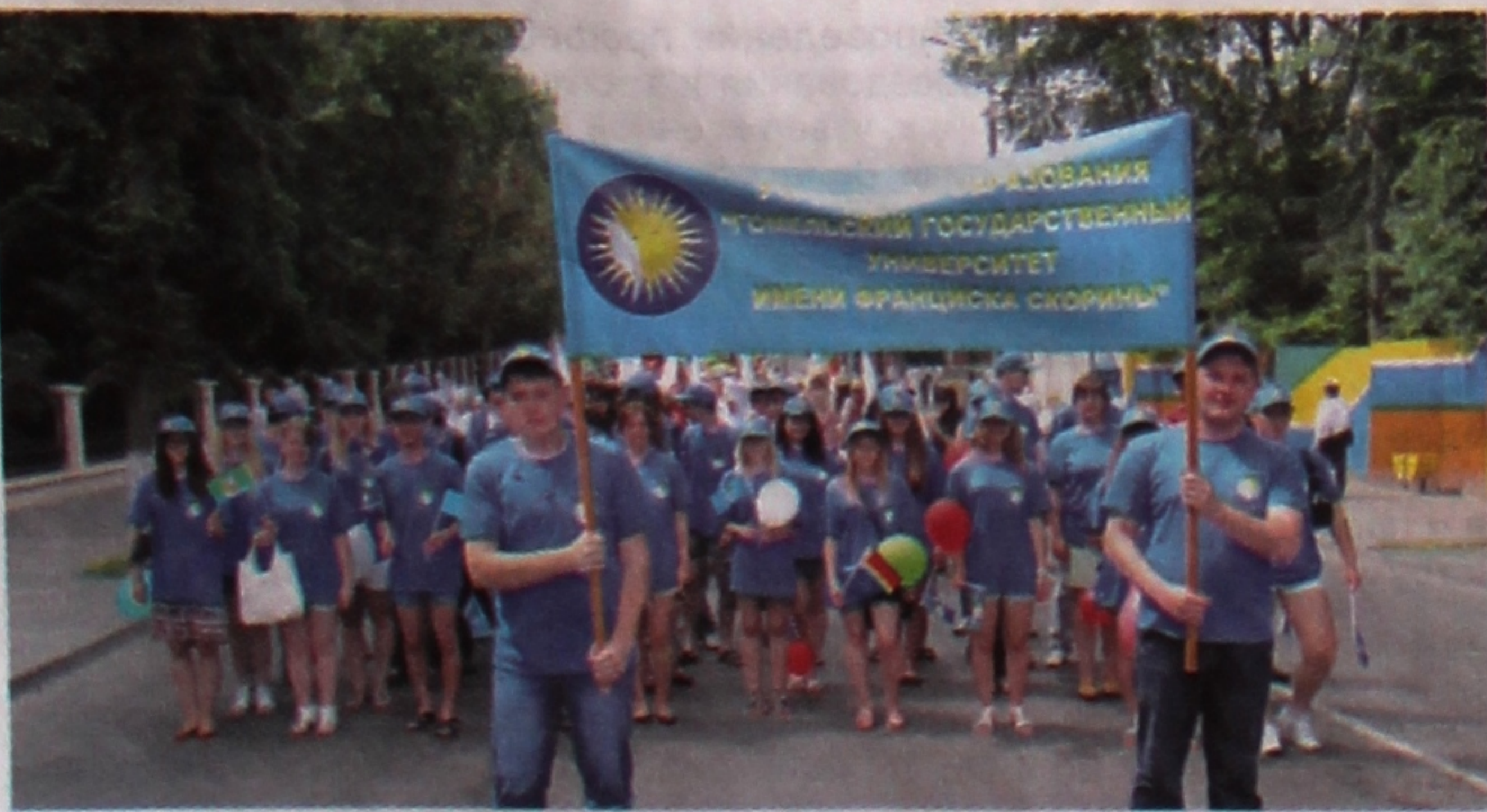
Мы – студэнты ГГУ ім. Ф. Скорины!

Заявы накіроўваць на адрас: 246019, г. Гомель, вул. Савецкая, 104. РЭКАТАР.